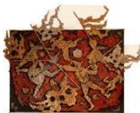
Andrea Raccagni Carosello di maschere 1960-61 Salone Scuola primaria Cappuccini