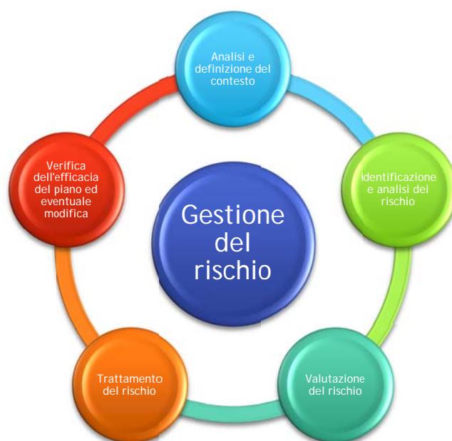
FIGURA 2 - LE FASI DEL PROCESSO DI RISK MANAGEMENT NELLE PREVISIONI DELLA LEGGE 190/2012