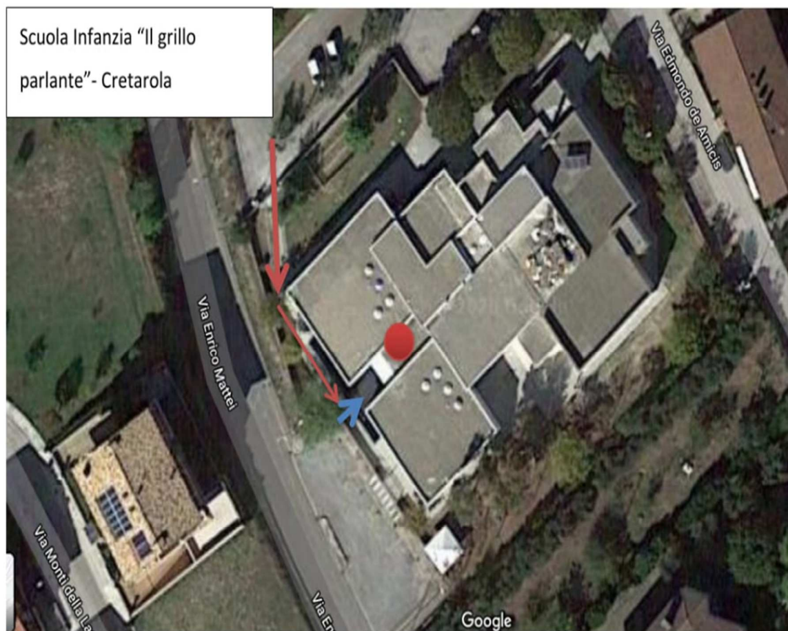
Figura 1. Mappa plesso scuola Infanzia IL grillo Parlante