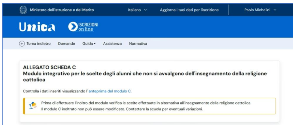
FIGURA 30 – OPZIONE ANTEPRIMA DI STAMPA

Prima di procedere con l’inoltro del modulo, ricorda di verificare le scelte effettuate. Se hai necessità di modificarlo, puoi farlo in due modi: