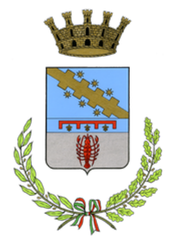
Comune di Cento