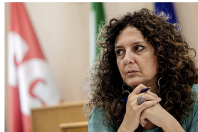
Seg. gen. FLC CGIL

Il Governo di destra, in carica da meno di un anno, ha annunciato una serie di riforme, alcune delle quali legate all'attuazione del PNRR. In particolare, sul settore scuola però la piegatura di parte di questi interventi rischia di riproporre schemi ideologici già conosciuti (e respinti) nel corso degli anni. Dal tutor al nuovo liceo del Made in Italy, fino alla riforma della filiera (sic) tecnico e professionale, è soprattutto sulla secondaria di secondo grado che si stanno appuntando le attenzioni del Ministro, con proposte non condivisibili che evidenziano una visione arretrata sia delle necessità della scuola italiana ma soprattutto delle soluzioni. In questa fase sarebbe importante avere uno sguardo lungo per coniugare riforme e obiettivi del nostro sistema formativo alla luce delle grandi sfide che impegneranno, non solo il nostro Paese, ma il mondo: dall'intelligenza artificiale, alla riconversione verde, alla digitalizzazione. Tutti questi processi collocano al centro dello sviluppo del Paese la scuola, l'università, la ricerca e l'AFAM. Tenere gli occhi rivolti all'indietro, non solo non risponde alle reali necessità - di investimento da un lato e di valorizzazione dall'altro - ma rischia di far perdere occasioni importanti per ridefinire la specializzazione produttiva e di sviluppo dell'Italia.