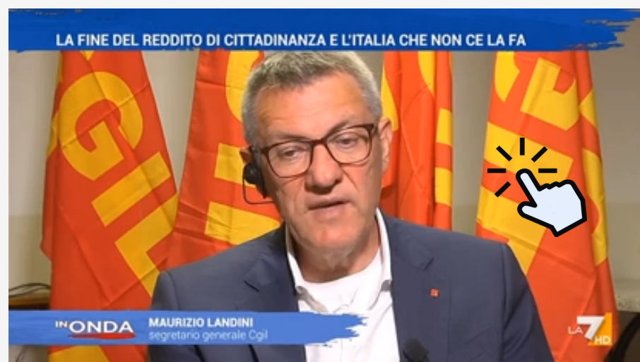
L'appello del segretario generale della Cgil a 'In Onda' su La7