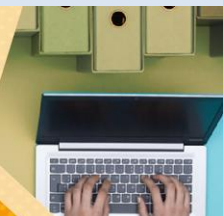
Illustrazione normativa di riferimento