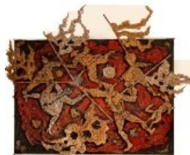
Andrea Raccagni Carosello di maschere 1960-61 Salone Scuola primaria Cappuccini