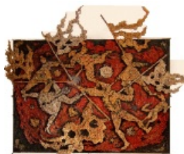
Andrea Raccagni Carosello di maschere 1960-61 Salone Scuola primaria Cappuccini

Scuola dell'infanzia, primaria e secondaria di primo grado Via Villa Clelia n. 18 – 40026 IMOLA (BO) Tel. 054240238 e 054240242 – Fax 0542628162 C.M. BOIC84700X – C.F. 82003770375 – Cod. Univoco Fatturazione: UFT8XQ e.mail: boic84700x@istruzione.it – pec: boic84700x@pec.istruzione.it – web www.ic6imola.edu.it