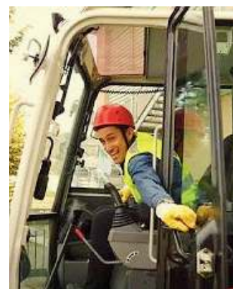
Testimonial d'eccezione. Il celebre Vincenzo Regis

■ La Scuola Edile presenta l'offerta formativa 2022/2023. È infatti al via il 27 novembre gli open day per scoprire il corso triennale in operatore edile, che rivolge ai ragazzi dai 14 ai 18 anni l'invito a conoscere il mondo delle costruzioni moderno: innovativo, attento alla sostenibilità e agli aspetti che determinano una migliore qualità della vita. Gli appuntamenti per conoscere da vicino l'offerta formativa del plesso scolastico di via della Garzetta cominciano dunque sabato 27 novembre, dalle 14 alle 16; seguiranno gli incontri dell'11 dicembre e del 15 gennaio.