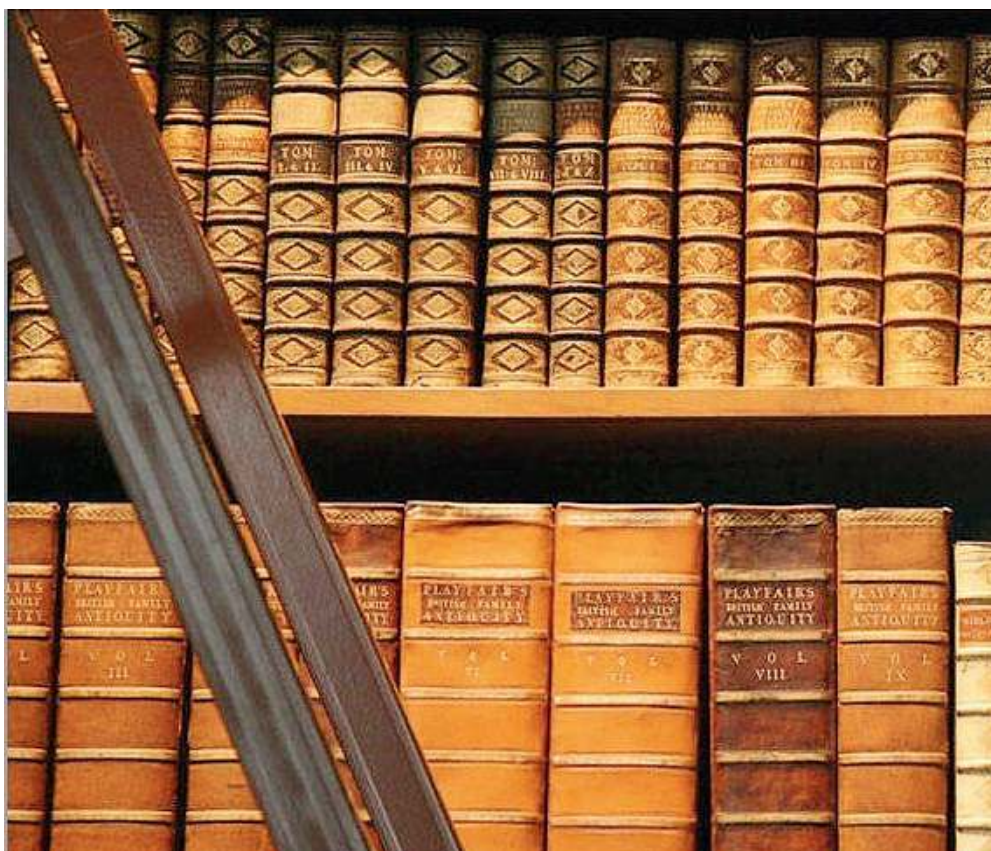
Passato e presente. Gli studi umanistici consentono una visione critica d'insieme