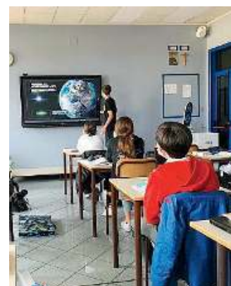
Scuola aperta. Ci si può prenotare per gli open day

■ Le scuole salesiane di Don Bosco hanno riaperto le porte per gli Open Day sabato scorso con oltre cento famiglie presenti in tutta sicurezza.