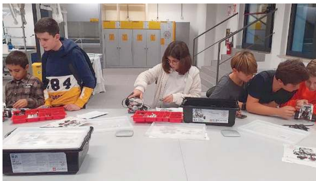
Alla prova. Studenti delle medie partecipano a un open day del Liceo Carli

Ancora: l'Informagiovani Brescia ( www.bresciagiovani.it , area formazione), oltre a programmare incontri sul tema con esperti, permette di fissare colloqui gratuiti personalizzati con operatori specializzati in orientamento e ri-orientamento scolastico, per potersi chiarire le idee e trovare il percorso formativo più adatto alle proprie attitudini ed esigenze. //