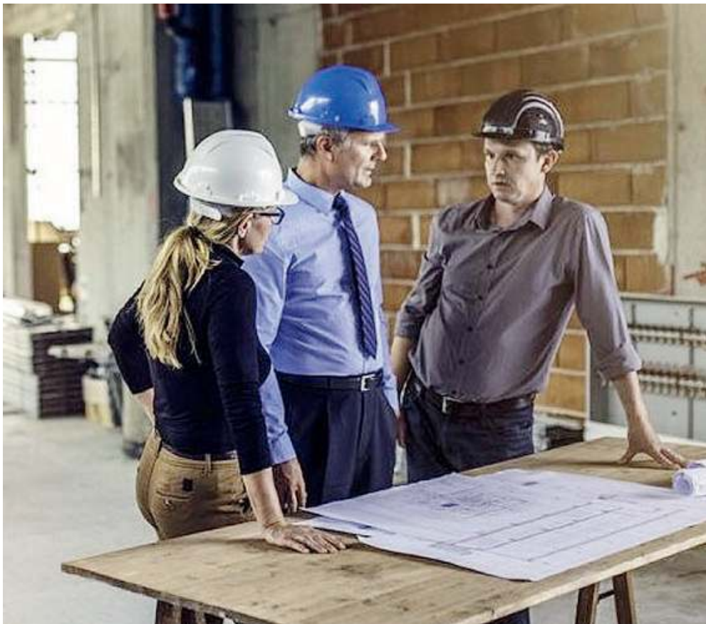
Al passo coi tempi. Settore rinnovato tra ambiente e tecnologia