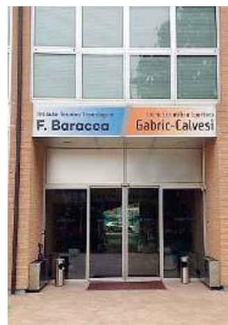
Dove. La sede è in via Mons. Fossati

I risultati di apprendimento attesi a conclusione del percorso quinquennale consentono