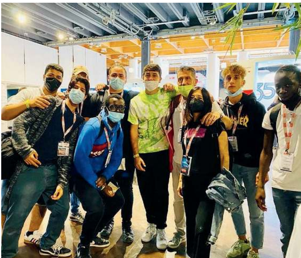
Entusiasmo. Sin dall'inizio dell'anno scolastico gli studenti visitano stand e aziende