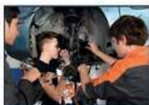
RIPARAZIONE VEICOLI A MOTORE