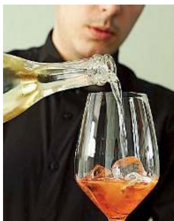
Didattica. Predilige l'approccio pratico

● L'offerta formativa del CFP Canossa, nella sede di Bagnolo Mella di via Mazzini 20, non solo propone opportunità capaci di inserire rapidamente gli allievi nel mondo del lavoro, ma li accompagna nella crescita individuale basata su una proposta educativa chiara. Se da un lato è possibile seguire percorsi triennali per il conseguimento della qualifica, a cui segue un quarto per il diploma professionale, dall'altro ci so-