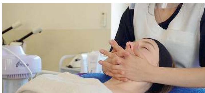
Fin dal primo anno. Gli studenti entrano subito nei laboratori

no messi in pratica anche negli stage curriculari in azienda, dove gli studenti possono consolidarli trasformandoli poi in possibili rapporti di lavoro. Questo metodo educativo è messo in pratica da un team di formatori e tutor altamente motivato ed in costante aggiornamento nella sede prestigiosa e funzionale in via Luzzago 1, che garantisce ampi spazi per la didattica in aula ed in laboratorio. La propensione a valorizzare gli studenti attraverso un costante monitoraggio degli apprendimenti consente ai ragazzi di immergersi subito nel mondo del la-