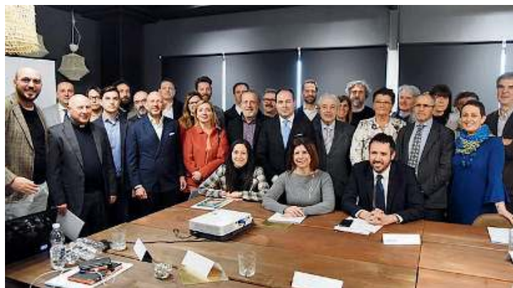
Tante realtà. Foto di gruppo per i rappresentanti del Coordinamento

Lo sviluppo di qualificate competenze professionali immediatamente spendibili nel mondo del lavoro è inoltre garantito da un cospicuo monte ore svolto in alternanza scuola lavoro fin dal secondo anno di corso. //