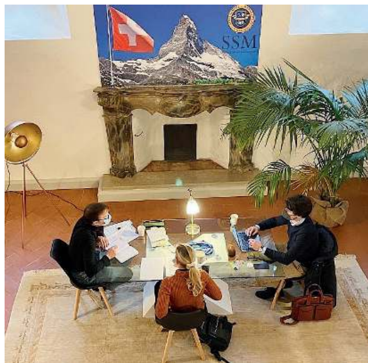
La sede. Il rettorato si trova in via Musei, di fronte al Museo di Santa Giulia

«La partecipazione alla società del futuro - rimarca iAnzuinelli - richiederà ai giovani ancor più grandi capacità di discernimento e di adattamento. Se guardiamo alle culture e alle nazioni che meglio hanno gestito l'incertezza e la necessità del cambiamento, hanno tutte assegnato all'educazione il ruolo fondamentale nel preparare i giovani all'indipendenza di giudizio. Dobbiamo essere loro vicini investendo nella preparazione. Solo allora, con la buona coscienza