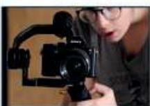
GRAFICA FOTOGRAFIA VIDEO