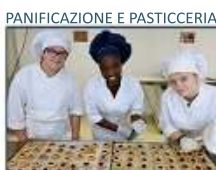
PANIFICAZIONE E PASTICCERIA