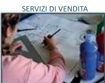
SERVIZI DI VENDITA