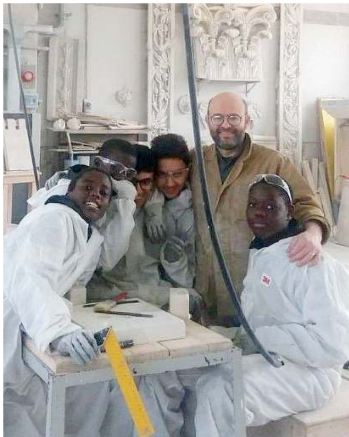
Nella terra del marmo. Proposte concrete per crescere insieme

Chi partecipa sarà chiamato a promuovere e valorizzare le realtà che vogliono potenziare la propria capacità di attrazione culturale e turistica, come comuni, enti, musei, teatri, biblioteche, associazioni, strutture ricettive e ricreative. E a valorizzare attività produttive come consorzi, imprese e aziende che intendono promuovere il «made in Italy». Chi, invece, cerca una scuola che insegni un lavoro e vuole avere la possibilità di impararlo sul campo già dai primi anni, può iscriversi al corso triennale di Operatore meccanico. E acquisire competenze per intervenire, a livello esecutivo, nel processo di produzione. Grazie alla rete di aziende socie, si possono fare esperienze di stage in importanti realtà meccaniche del territorio. Info: www.vantini.it . //