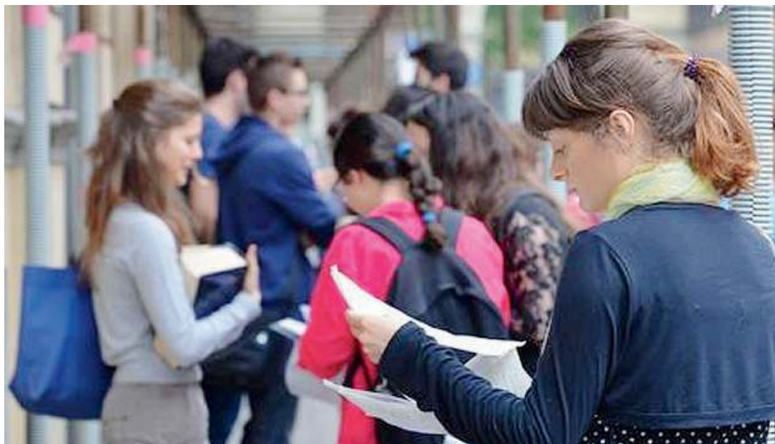
A Mompiano. Una proposta formativa flessibile e innovativa

Con personalità. Il Liceo Novalis, in continuità con i presupposti della Novalis Open School, re-