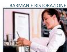
BARMAN E RISTORAZIONE