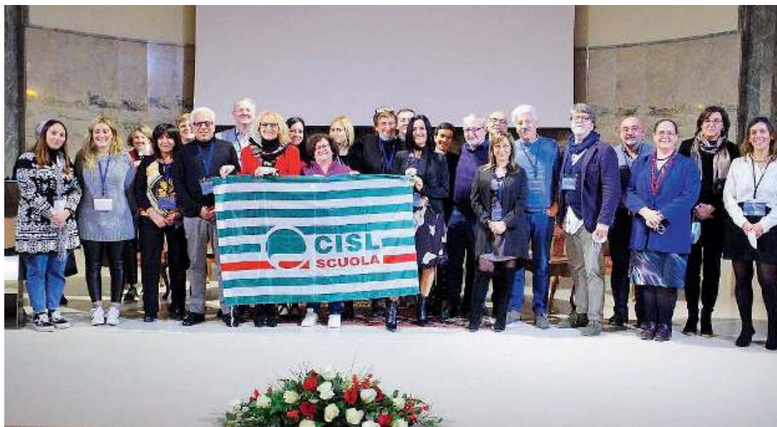
Dall'ultimo congresso. Foto di gruppo per i rappresentanti della Cisl Scuola di Brescia

Il punto. L'ultimo rinnovo, che si riferisce agli anni dal 2016 al 2018, è avvenuto sulla soglia di scadenza del Governo Gentiloni ed ha pertanto ottenuto la sistemazione di alcuni temi preoccupanti che hanno inciso sul lavoro quotidiano a scuola: il ritorno di alcune materie come oggetto di contrattazione, usurpate da interventi legislativi precedenti; la contrattazione del compenso per la valorizzazione del merito (bonus premiale) introdotto dalla Legge 107/2015, la Buona Scuola, ma illegittimamente sottratto alla contratta-