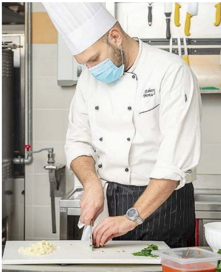
In cucina. Un allievo mette in pratica gli insegnamenti ricevuti

L'offerta formativa, totalmente gratuita, prevede quattro corsi triennali per ottenere la qualifica professionale (Operatore della ristorazione, Operatore della trasformazione agroalimentare - pasticceria, Operatore di sala bar e Operatore agricolo), quattro percorsi per l'acquisizione del titolo di tecnico di settore e, da settembre 2021, un quinto anno nel settore alberghiero che consente di accedere al diploma di maturità.