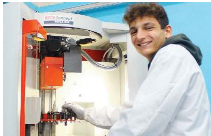
I laboratori. Uno dei punti di forza del Centro Aib

Nella sede di Ome gli Operatori Meccanici si occupano di impianto automatizzato, isola, robot, controllando le parti elettromeccaniche, riparandole, sostituendole, collaudandole.