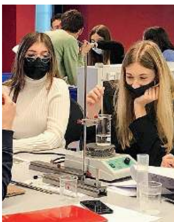
Temi. Molte attività laboratoriali

L'istituto è un attore di cambiamento nel panorama dell'istruzione paritaria e da sempre adotta metodologie didattiche innovative: dalla «flipped classroom» all'apprendimento cooperativo, dagli episodi di apprendimento