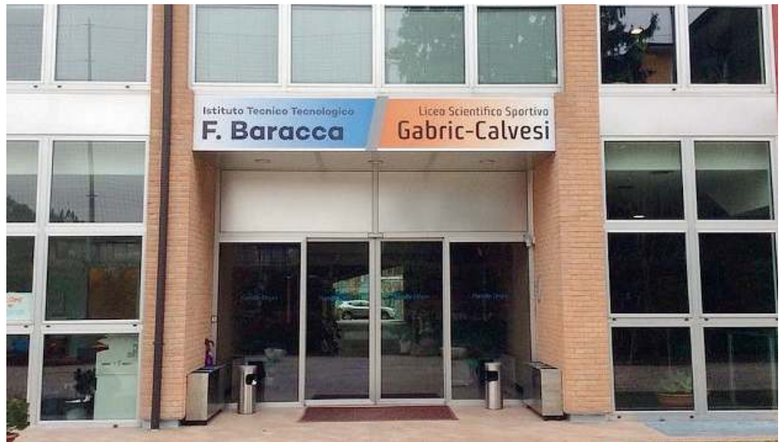
In via Monsignor Fossati. Il comune ingresso dell'istituto Baracca e del liceo Calvesi

Offerta. L'istituto tecnico tecnologico Baracca si articola in due indirizzi: Meccanica e Meccatronica, particolarmente calato sulla realtà produttiva bresciana, e Trasporti e Logistica, che si articola a sua volta in due sotto-indirizzi. Vale a dire Costruzione e Conduzione del mezzo terrestre, navale e aereo. Percorsi altamente professionalizzanti, dunque, che portano all'Esame di Stato e proiettano verso