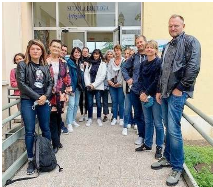
Studenti. Uno scatto d'archivio della Scuola Bottega