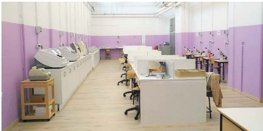
Modernissimo. Il rinnovato laboratorio di ottica con tecnologia all'avanguardia

Ai primi posti. Il settore Made in Italy si sviluppa su due settori, Moda e Arredo. Per quanto riguarda Moda (da rilevare che la scuola è inserita nella rete nazionale Tam, che riunisce gli istituti di questo settore), l'anno scorso gli studenti del Fortuny si sono piazzati al primo e al terzo posto nella gara nazionale e pertanto quest'anno la competizione si svolgerà a Brescia, proprio al Fortuny, dal 3 al 5 maggio. Non da meno, poi, l'indirizzo Arredo: