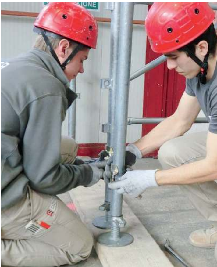
Ponteggi. Alla scuola si impara come montarli e come smontarli

re edile, specialista in Edilizia innovativa, efficienza energetica e macchine operatrici, prevede oltre 400 ore annuali di stage a partire dal secondo anno e alterna lezioni teoriche ed esercitazioni pratiche per fornire allo studente un bagaglio di competenze spendibili subito dopo il diploma.