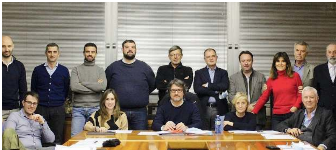
Il Consiglio. Foto di gruppo per i componenti del Consiglio del Collegio dei Geometri

Laboratori. Una ulteriore grande opportunità, di conseguenza, per rinnovare, in alternativa al corso di laurea professionalizzante, le professionalità presenti nelle imprese con l'inserimento di tecnici giovani, che siano in possesso di un'innata attitudine per le strumentazioni elettroniche, e che, attraverso l'approccio tipicamente laboratoriale del corso ITS, acquisiscano le competenze digitali e di utilizzo di strumenti IoT secondo la rivoluzione 4.0 anche nei cantieri edili.