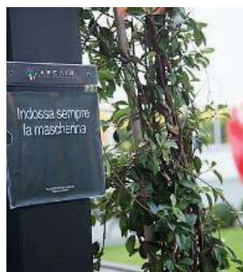
Sicurezza. La scuola al tempo del Covid

sarà garantito anche in contesti pratici come laboratorio e stage obbligatorio nelle imprese. Si può, dunque, anche lavorare mentre si studia. Dal secondo anno i periodi di stage potranno essere svolti anche attraverso l'as-