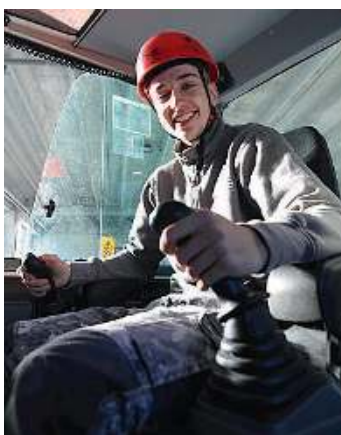
Alla guida. Un allievo su un mezzo

con autonomia, nel quadro di azione stabilito e dei compiti assegnati, contribuendo al processo delle costruzioni edili attraverso l'individuazione delle risorse materiali e strumentali; la predisposizione, l'organizzazione operativa e l'implementazione di procedure di miglioramento continuo delle lavorazioni; il monitoraggio e la valutazione del risultato, con assunzione di responsabilità relative alla sorveglianza di attività esecutive svolte da altri.