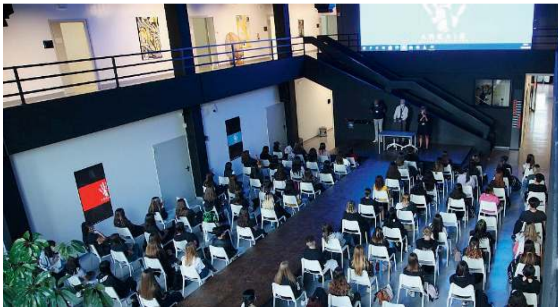
Ampi spazi. La grande e modernissima sala eventi della Ok School

● In via Reggio, nella zona nord della città, sfruttando spazi più ampi e strutture studiate su modelli innovativi che superano le tradizionali disposizioni, è nata da un paio d'anni la nuova sede di Ok School, un vero gioiello per il nostro territorio, che ha avviato una nuova, stimolante avventura. La struttura completamente ristrutturata e modernizzata si sviluppa su circa 4mila metri quadrati nell'area di Casazza, dove dapprima era collocato il Fortuny. Grazie a un investimento di oltre 600mila euro, all'interno trovano posto 25 aree tematiche, altrettante aule didattiche, otto laboratori tecnologicamente avanzati, un'area high tech, ma anche una zona dedicata ad eventi, una piazza creativa, due gallerie d'arte e