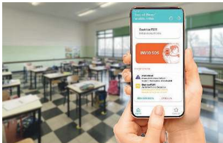
Soluzione informatica. L'interfaccia è semplice e intuitiva

Tutte le informazioni dettagliate si possono trovare visitando il sito Internet www.sosscuole.it .