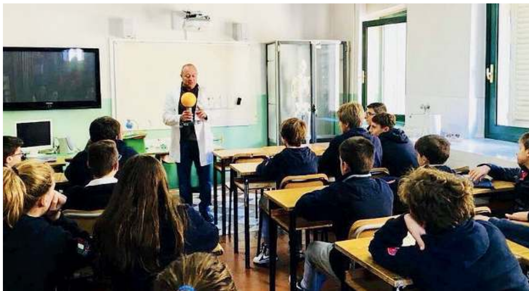
In classe. Giovani studenti seguono attentamente una lezione alla Bilingual Middle School of Brescia

Studenti al centro. Gli appuntamenti organizzati tra novembre e gennaio sono stati quattro: genitori e ragazzi hanno potuto prendervi parte su prenotazione, nel rispetto delle normative vigenti, e sfruttando la «doppia modalità». Da un lato, le presentazioni mirate, per i nuovi iscritti al primo anno scolastico, dall'altro le consulenze personalizza-