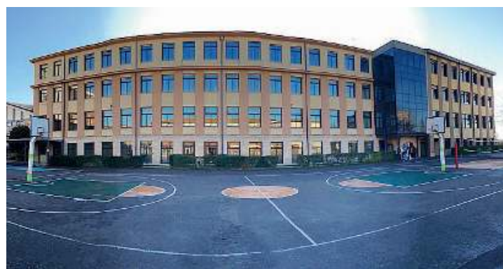
Istituto. La scuola Don Bosco

La formazione salesiana, sia scolastica che educativa, è costruita in modo coerente attraverso i diversi ambienti e fasce d'età: dalla scelta della scuola