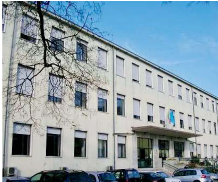
La sede. Una veduta dell'istituto statale di istruzione superiore Piero Sraffa

Iscrizioni. Nel giorni 11, 13, 18, 20, 25 e 27 gennaio c'è infatti «Scuola aperta»: sempre dalle