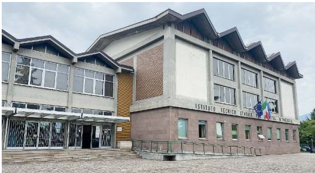
La sede. Una veduta esterna dell'Istituto di istruzione superiore Tartaglia-Olivieri

● All'Istituto di istruzione superiore Tartaglia-Olivieri si sono da poco concluse le attività di orientamento rivolte agli studenti delle terze medie. È stata loro presentata l'offerta formativa dell'Istituto, costantemente aggiornata per rispondere ai molteplici interessi e aspirazioni dei giovani, come pure alle esigenze del territorio, del mondo del lavoro e degli studi futuri. Ad esempio, dallo scorso anno vengono realizzate attività di potenziamento rivolte sia alle discipline di base (lingua italiana, inglese e matematica), sia a quelle professionalizzanti. Iniziative integrative come per esempio di progettazione BIM (Building Information Modeling), di metodologia estimativa, di sicurezza nei cantieri, di rilievo topografico e fotogrammetria digitale. Gli studen-