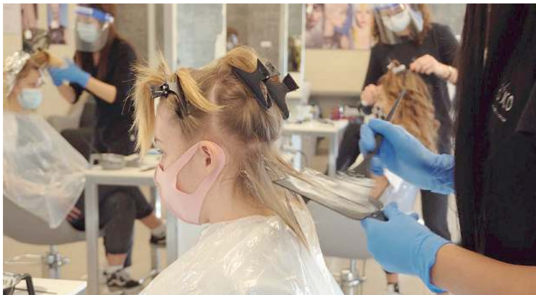
In laboratorio. La scuola si caratterizza per le numerose prove pratiche: così si formano i professionisti del futuro

Dal web al benessere. Chi vuole puntare sul successo lavorativo trova ad Educo il suo punto di riferimento nei settori Acconciatura, Estetica, Servizi Commerciali di Vendita & Marketing ed Elettrico - Impianti civili, industriali e del terziario. Tutti i corsi professiona-