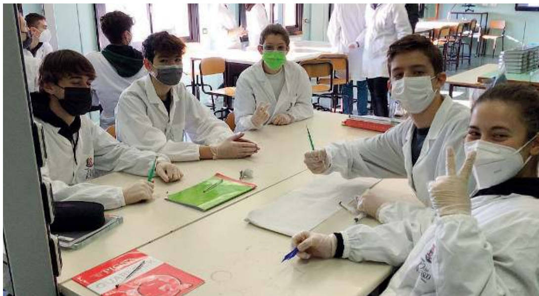
Con la mascherina. La vita quotidiana nella scuola ai tempi del Covid

L'Istituto Tecnico Tecnologico, attraverso la somministrazione ai propri studenti di un son-