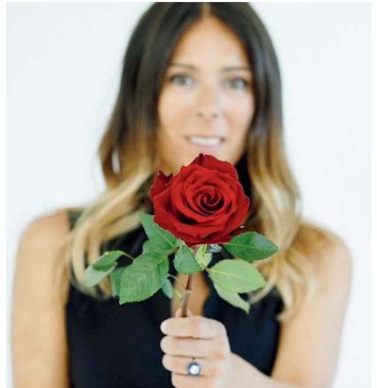
Simbolica. L'inglese potrà sbocciare come una rosa

È possibile contattare Iseo English anche via WhatsApp al numero 030.3660405 oppure inviare una mail all'indirizzo info@