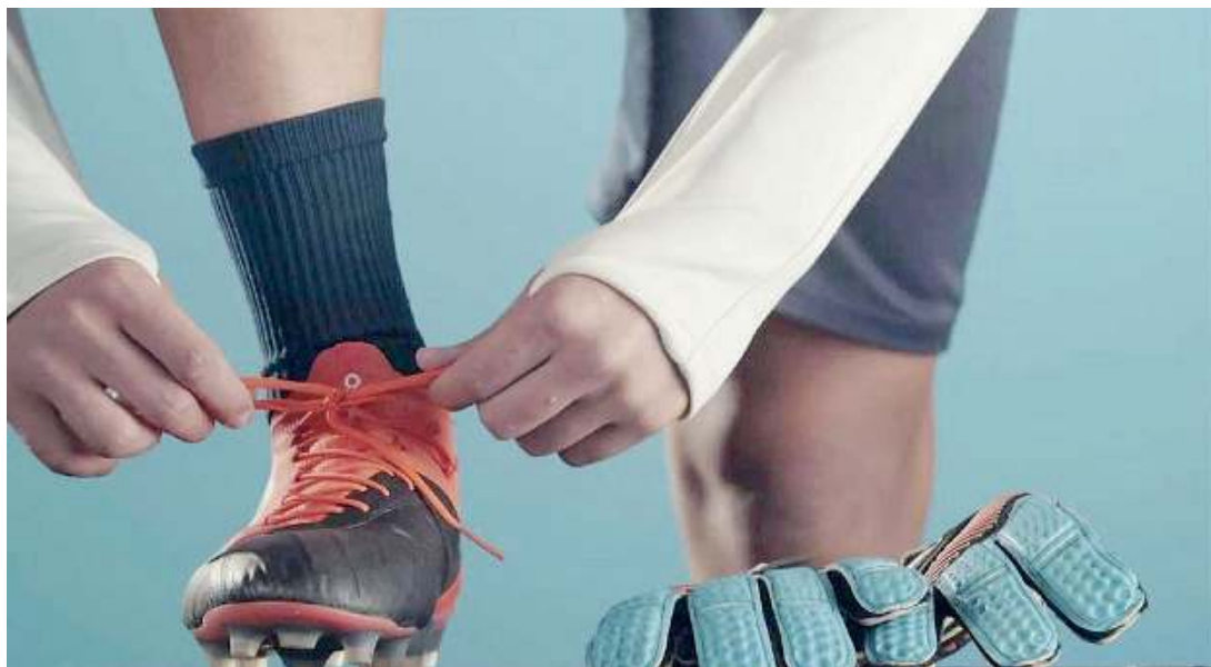
Sport. Ai Licei Marco Polo è attivo un indirizzo con potenziamento sportivo

All'avanguardia. L'offerta scolastica promossa da Licei Marco Polo ha come obiettivo quello di dare ai ragazzi una formazione solida e all'avanguardia, offrendo indirizzi di studi differenti a seconda delle passioni e delle ambizioni degli studenti. L'allievo può così scegliere tra tre piani di studio differenti: tradizionale, potenziamento sportivo, potenziamento linguistico. Indipendentemente dalla scelta dell'indirizzo, comun-