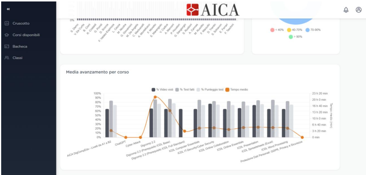
Figura 3 - sezione "Statistiche classe" raggiungibile da "Classi" su AICA-LAB.