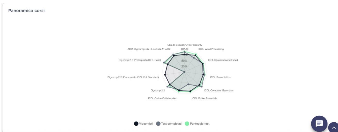
Figura 4 - Grafico radar incluso nella sezione "Statistiche classe" su AICA-LAB.