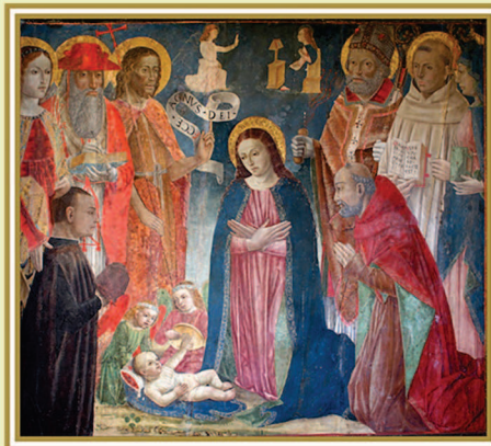
Sormano: la scena della natività nella chiesa di Santa Maria del Sasso a Dicinasio