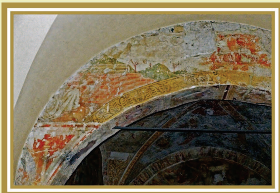
Rezzago: la scena della annunciazione nella chiesa dei Santi Cosma e Damiano