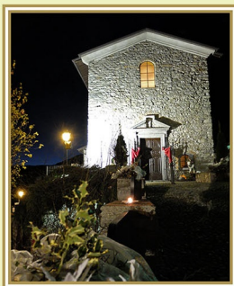
3) Caglio chiesa dei Santi Gervaso e Protaso (Parrocchiale) "Adorazione di Gesù"