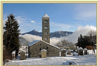
1) Rezzago chiesa dei Santi Cosma e Damiano "Annunciazione"

Ciascuno di questi episodi, ricostruito figurativamente nel Presepe e collocato in ogni singola chiesa, rappresenterà quanto il pittore ha voluto esprimere nella sua opera. Nella speranza di essere riusciti a realizzare un Presepe originale e che questo possa sollecitare l'attenzione di coloro che ci dedicheranno un poco del loro tempo, vi invitiamo a seguire il percorso di visita qui indicato: