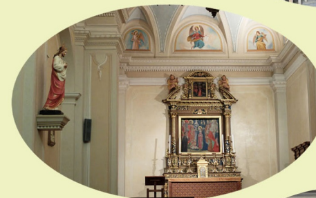
CAGLIO CHIESA PARROCCHIALE DEI SANTI GERVASO E PROTASO