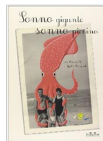
Sonno Gigante Sonno piccino Giusi Quarenghi Giulia Sagramola Ed. Topipittori 2014

Per: parlare di litigi e distacchi, affrontare il tema della mancanza, ragionare sulla natura dei rapporti di amicizia, scoprire la forza della fotografia come mezzo per raccontare le storie, imparare ad osservare i dettagli delle immagini, approcciare il testo poetico, giocare con la fantasia.