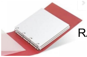
RACCOGLITORE AD ANELLI