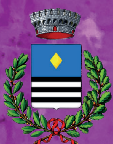
Comune di Isola Dovarese