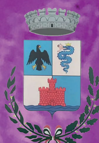
Comune di Piadena Drizzona