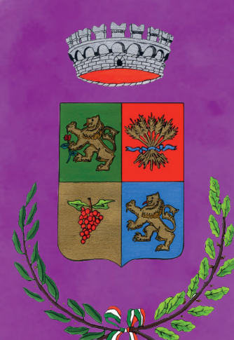
Comune di Tornata