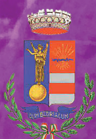
Comune di Calvatone