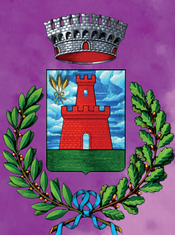
Comune di Pessina Cremonese