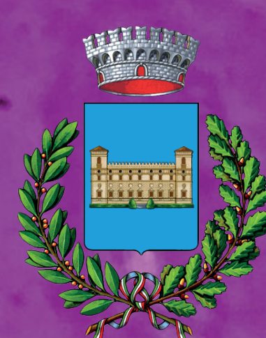
Comune di Torre De' Picenardi