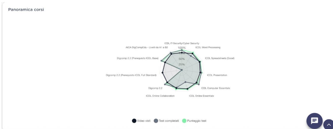
Figura 4 - Grafico radar incluso nella sezione "Statistiche classe" su AICA-LAB.