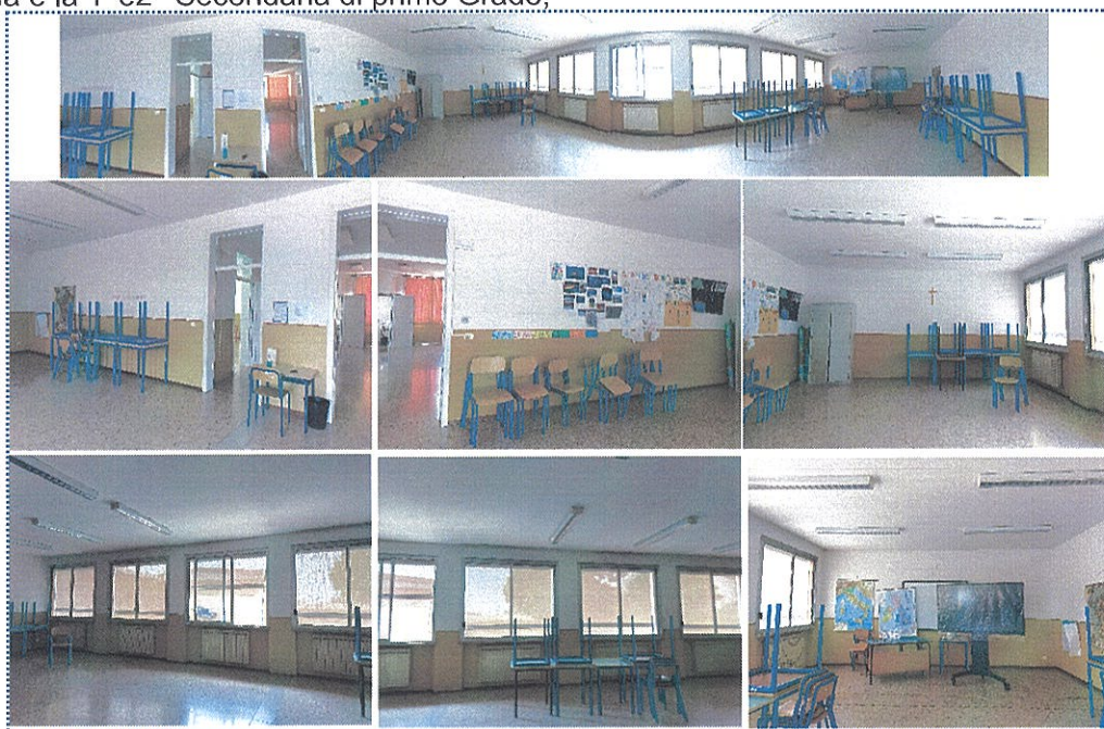
Figura 6-Aula n° 21-Scuola Sec. di Primo Grado-Rivarolo del Re

-le aule n° 21, 19 (oppure 11, *per il motivo suddetto), nella Scuola Secondaria di Primo Grado, e la n° 32, nella Scuola Primaria, saranno le aule fisse delle classi che nell'A.S. 2024/2025 saranno la 5^primaria e la 1^e2^ Secondaria di primo Grado;