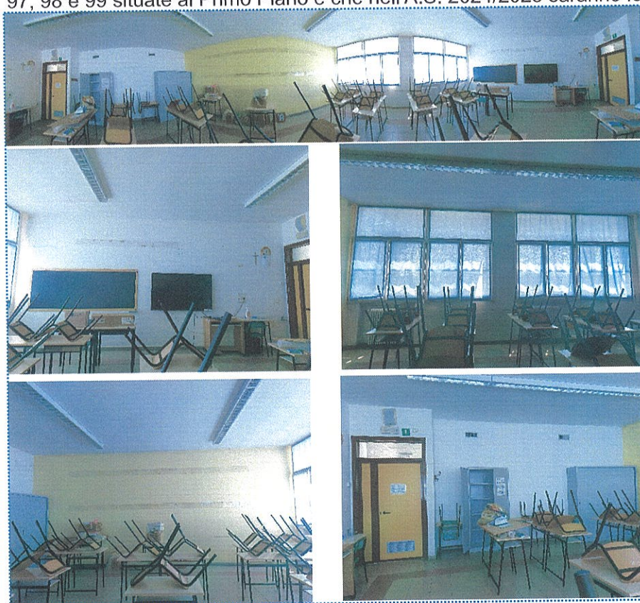
Figura 19 Aula n° 96-Scuola Primaria-Casalmaggiore

-le aule n° 96, 97, 98 e 99 situate al Primo Piano e che nell'A.S. 2024/2025 saranno le classi quinte;