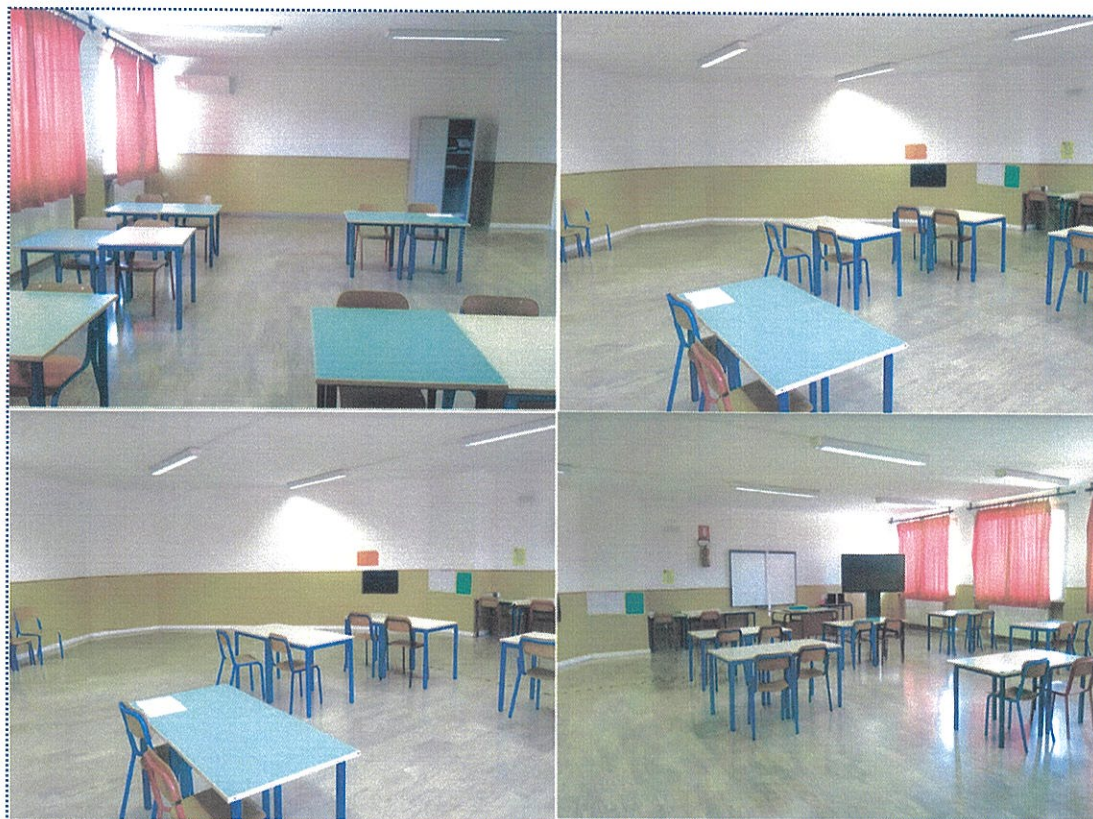
Figura 2 - Aula n° 23 - Scuola Sec. di Primo grado - Rivarolo del Re

-l'aula n° 22 (sita al secondo piano) è ideale come ambiente di apprendimento dedicato all'ed. musicale, al suo interno verranno posizionati strumenti musicali e arredi adatti;