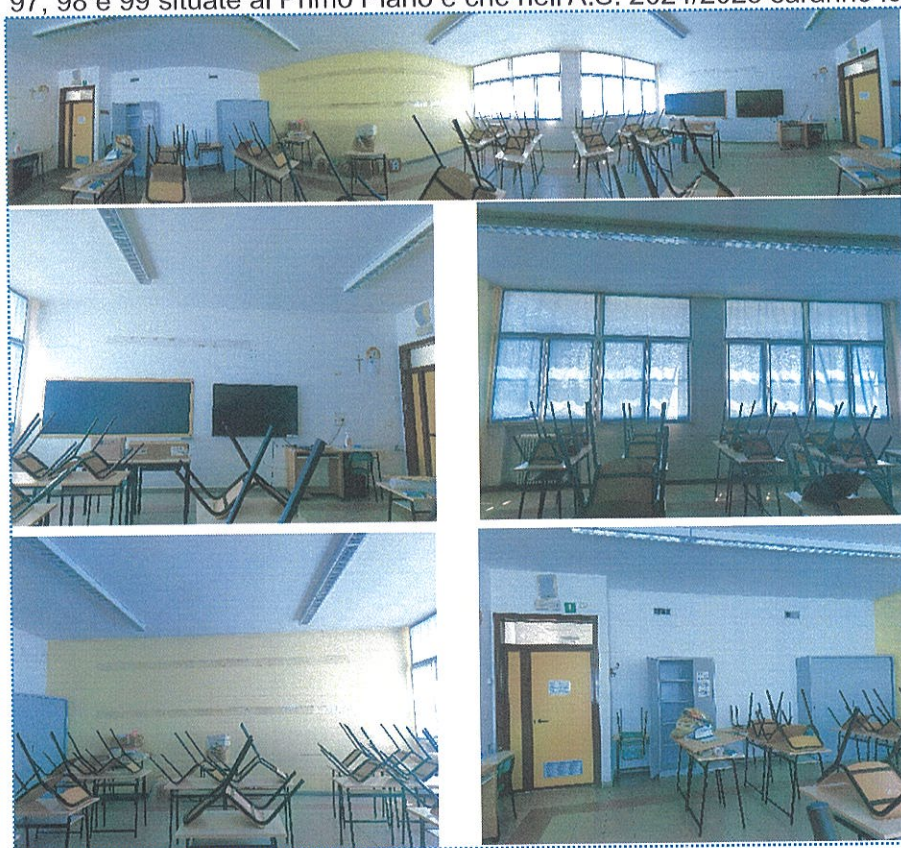
Figura 19 Aula n° 96-Scuola Primaria-Casalmaggiore

-le aule n° 96, 97, 98 e 99 situate al Primo Piano e che nell'A.S. 2024/2025 saranno le classi quinte;