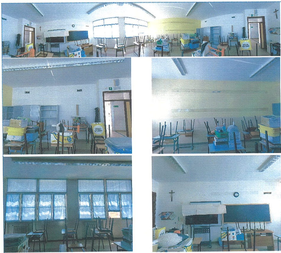
Figura 22 Aula n° 99-Scuola Primaria-Casalmaggiore