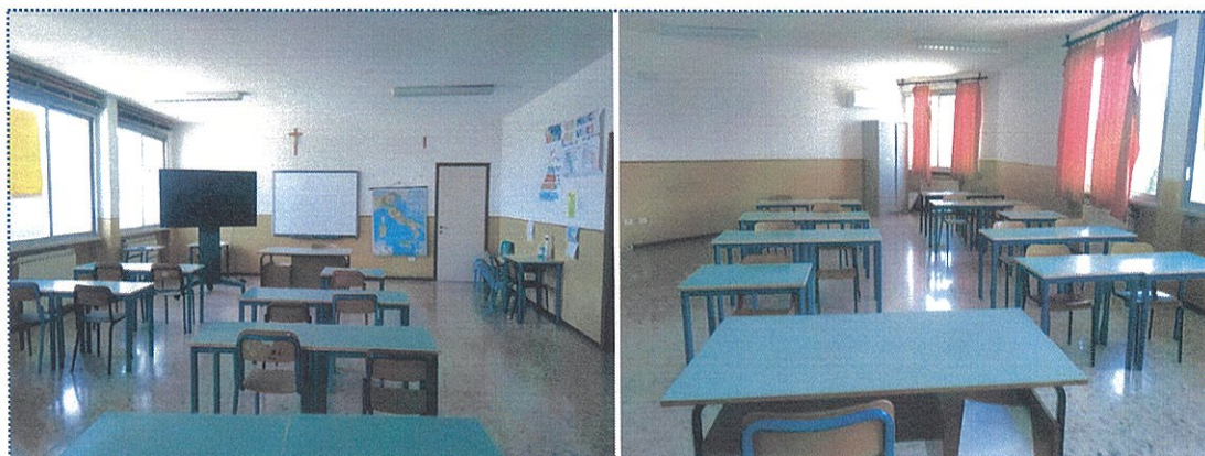
Figura 3 - Aula n° 22- Scuola Sec. di Primo Grado - Rivarolo del Re

-l'aula n° 22 (sita al secondo piano) è ideale come ambiente di apprendimento dedicato all'ed. musicale, al suo interno verranno posizionati strumenti musicali e arredi adatti;