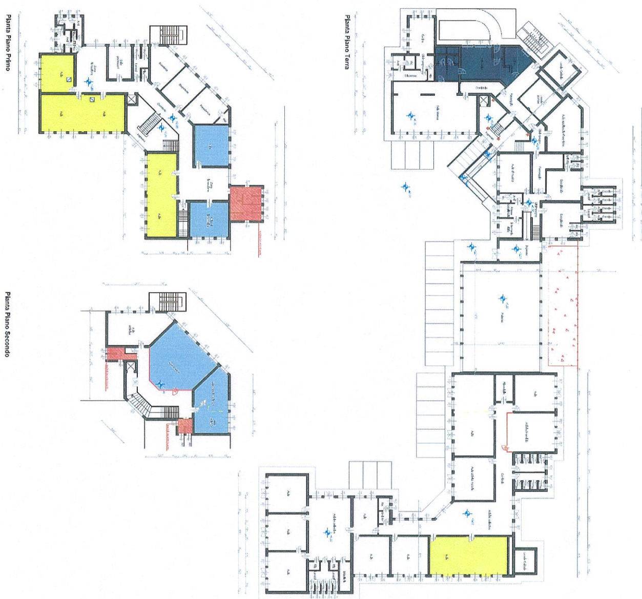
Figura 1 - Plesso Scuole Rivarolo del Re

-l'aula n° 23 (sita al secondo piano dello stabile) diventerà l'aula immersiva; l'ampia metratura la rende luogo ideale per i monitor, presenta una buona flessibilità degli spazi e una buona acustica. All'interno della stessa aula si possono posizionare anche banchi modulabili, monitor touch con carrello e anche il Kit Green Screen che può essere facilmente spostato, quindi, si presta a essere usato in qualsiasi spazio;