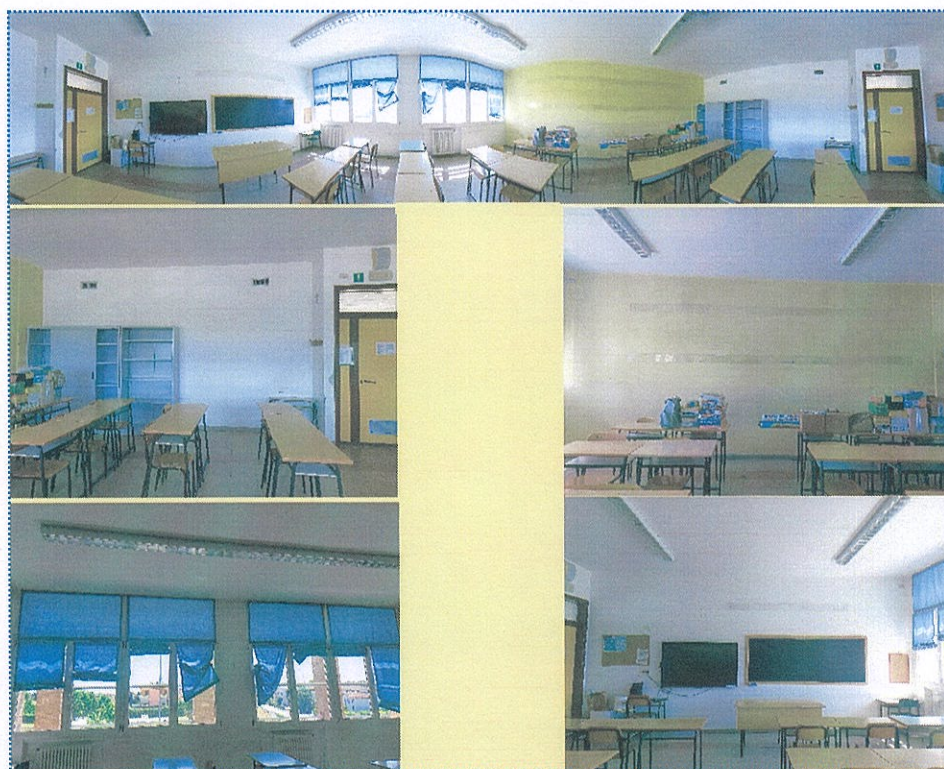
Figura 26 Aula n° 115-Scuola Primaria-Casalmaggiore