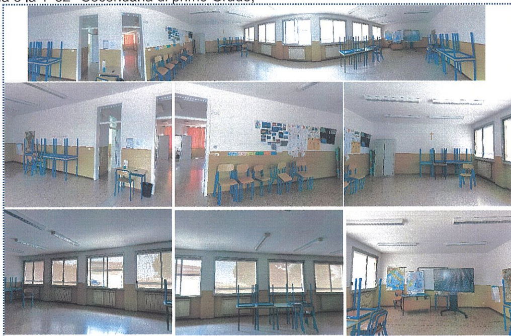
Figura 6-Aula n° 21-Scuola Sec. di Primo Grado-Rivarolo del Re

-le aule n° 21, 19 (oppure 11, *per il motivo suddetto), nella Scuola Secondaria di Primo Grado, e la n° 32, nella Scuola Primaria, saranno le aule fisse delle classi che nell'A.S. 2024/2025 saranno la 5 a primaria e la 1 a e2 a Secondaria di primo Grado;