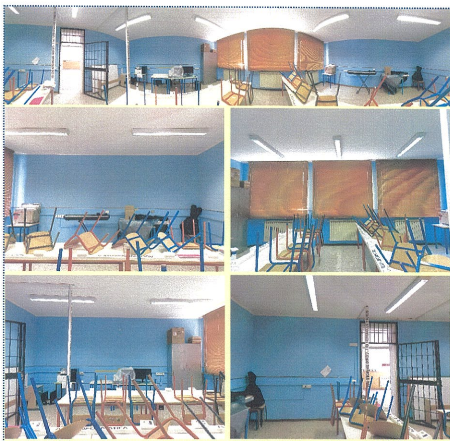
Figura 5-Aula n° 8-Scuola Sec. di Primo Grado-Rivarolo del Re