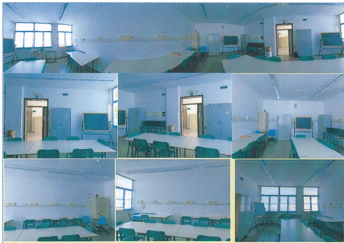
Figura 14-Aula n° 100- Scuola Primaria Casalmaggiore

-l'aula n° 100 diventerà un ambiente di apprendimento dedicato al potenziamento delle competenze di base, al suo interno saranno inseriti un monitor touch e dei kit didattici dedicati alle discipline principalmente di Italiano e Matematica e all'alfabetizzazione Italiano L2;