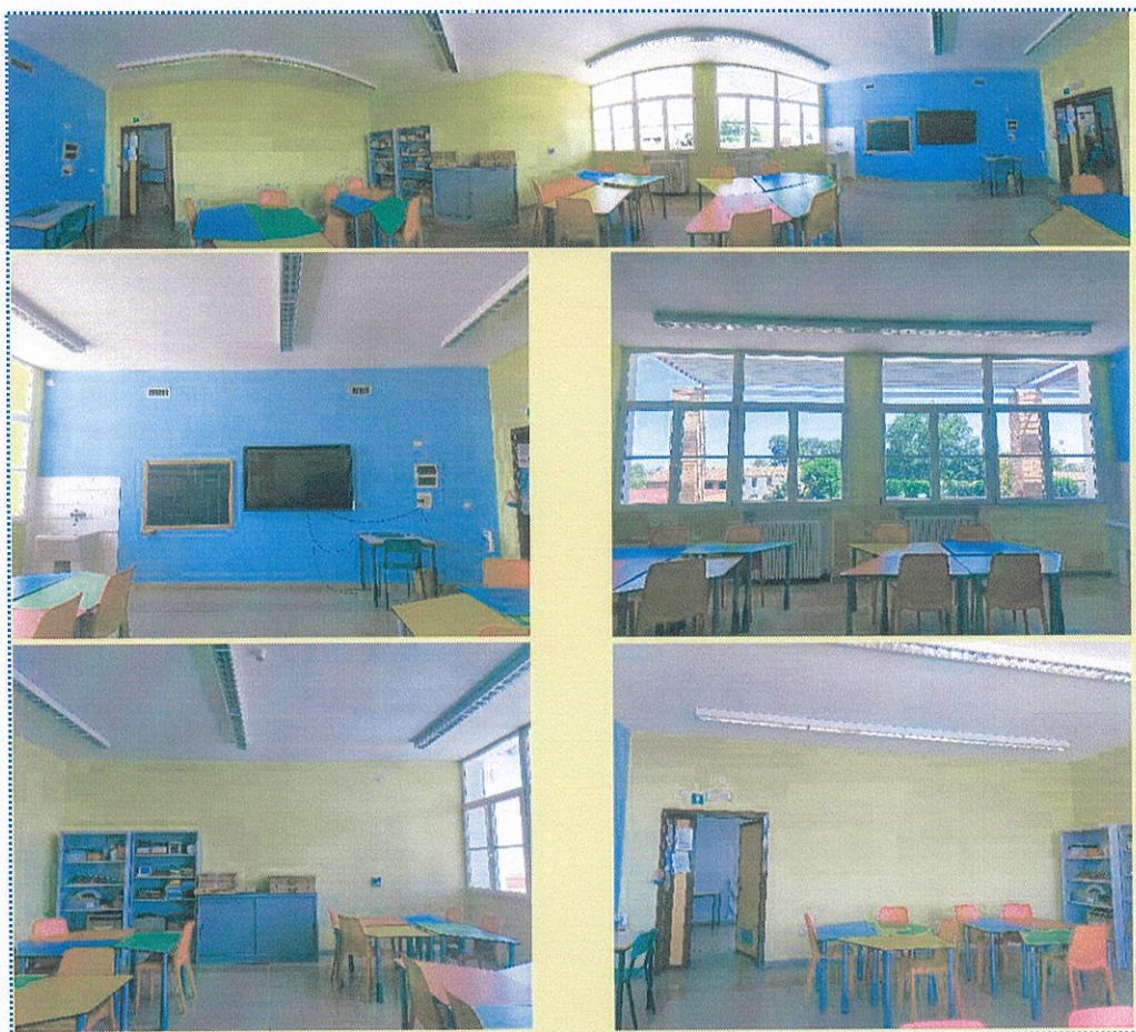
Figura 12-Aula n° 86-Scuola Primaria-Casalmaggiore

-l'aula n° 17 sarà adibita a secondo ambiente di apprendimento per discipline STEAM e Coding, sfruttando le dotazioni già presenti all'interno dell'Istituto e implementando con i nuovi acquisti;