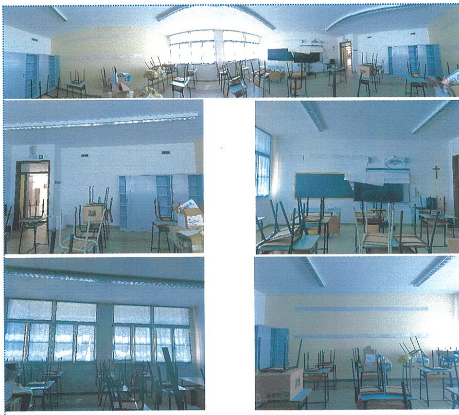
Figura 21 Aula n° 98-Scuola Primaria-Casalmaggiore