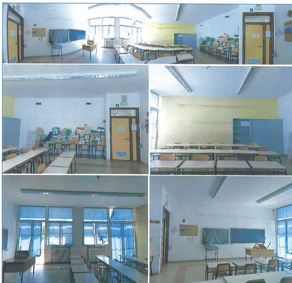
Figura 18 Aula n° 65-Scuola Primaria-Casalmaggiore