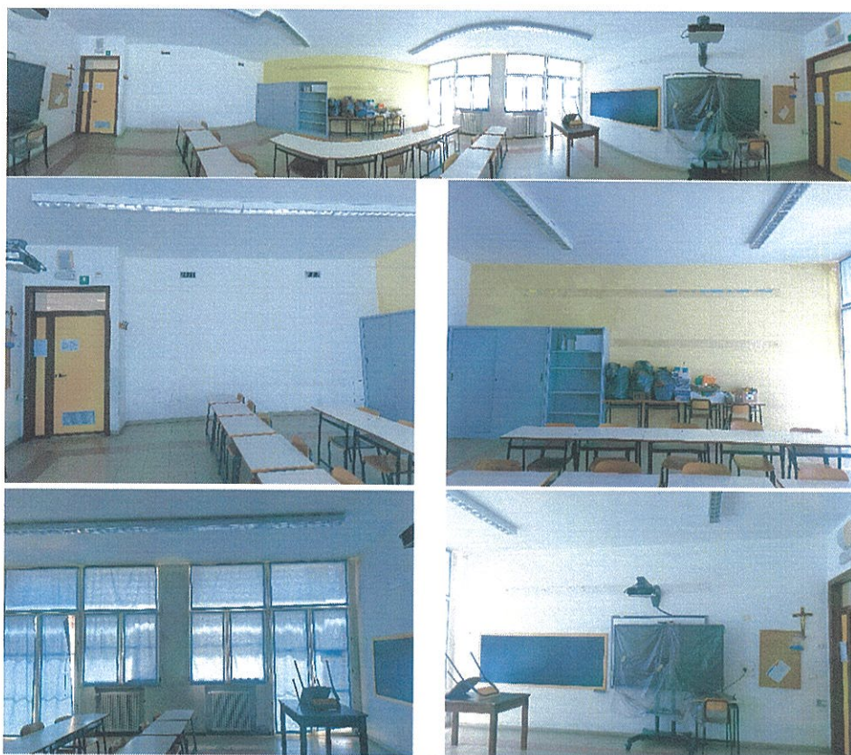
Figura 17 Aula r.° 64-Scuola Primaria-Casalmaggiore