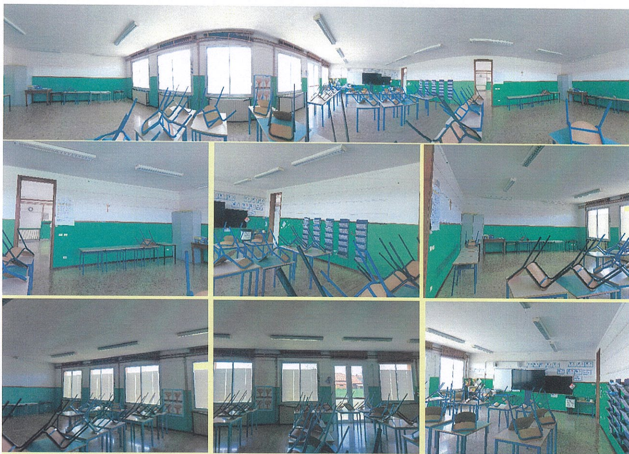
Figura 8-Aula n° 32-Scuola Primaria-Rivarolo del Re