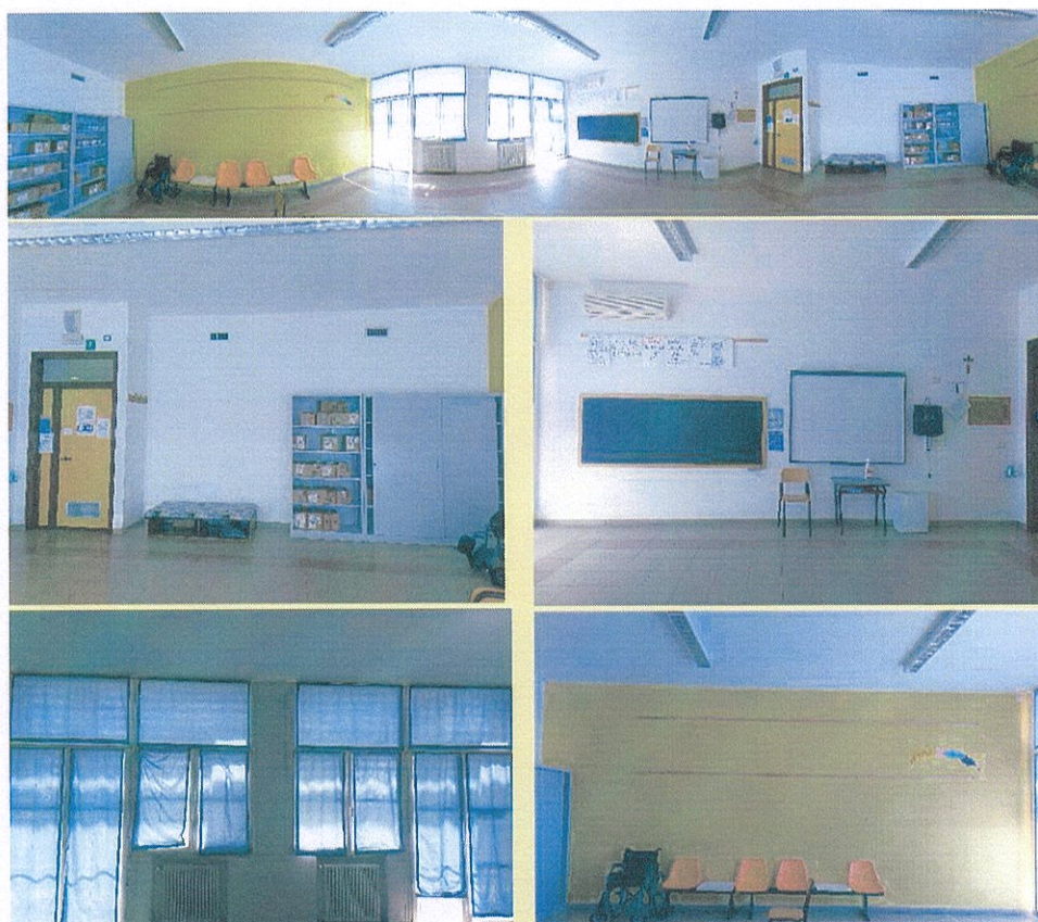
Figura 15-Aula n° 62-Scuola Primaria-Casalmaggiore

Le aule fisse della Scuola Primaria di Casalmaggiore saranno -le n° 62, 63, 64 e 65 situate al Piano Terra e che, nell'A.S. 2024/2025 saranno le classi quarte;