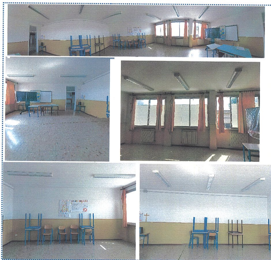
Figura 4-Aula n° 7-Scuola Sec. di Primo Grado-Rivarolo del Re