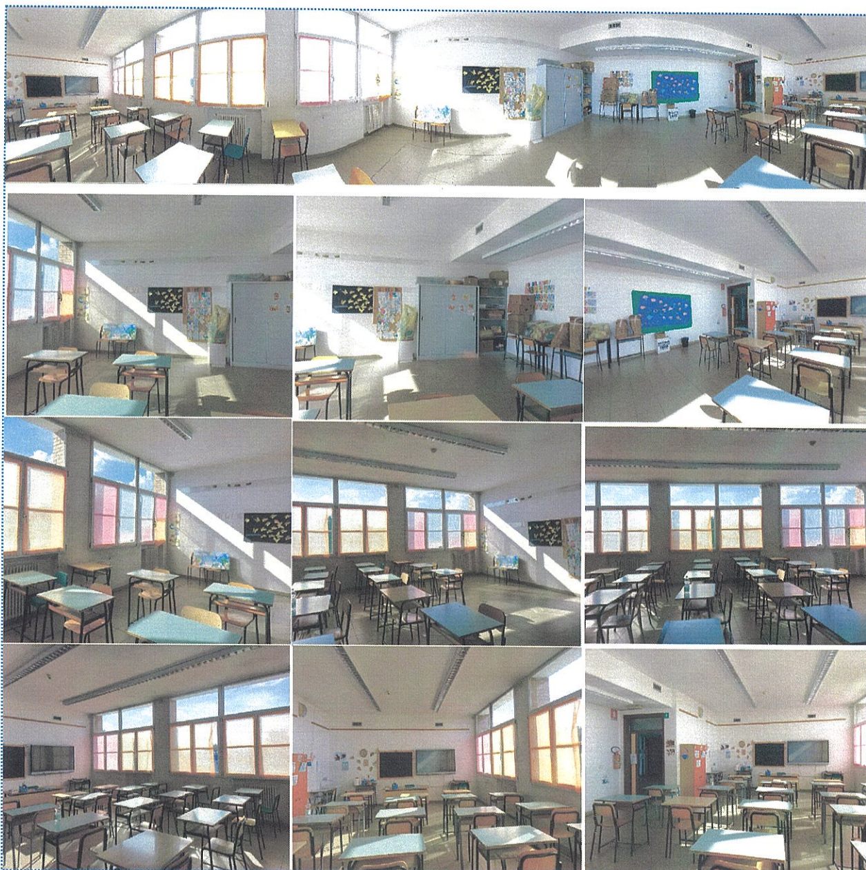
Figura 11 Aula n° 118-Scuola Primaria-Casalmaggiore

- l'aula n° 118 (sita al primo piano lato sx) sarà adibita ad aula immersiva in quanto essa ha tutte le caratteristiche per poter accogliere le strumentazioni necessarie, oltre a essere flessibile per diversi utilizzi. Si potranno, inoltre, inserire, al suo interno, una parte dei kit dedicati al coding e il kit Green Screen, che può essere facilmente trasportato in altri ambienti;