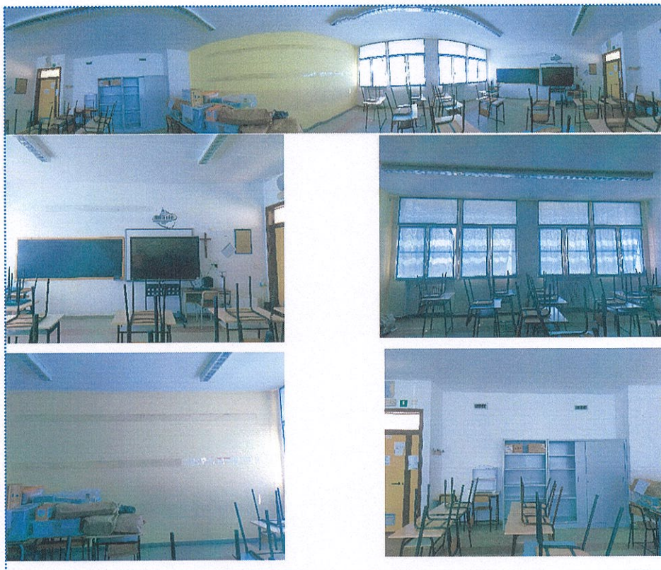
Figura 23 Aula n° 102-Scuola Primaria-Casalmaggiore

-le aule n° 102, 103, 114 e 115 situate al Primo Piano e che nell'A.S. 2024/2025 saranno le classi terze