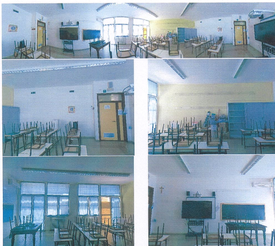
Figura 16 Aula n° 63- Scuola Primaria-Casalmaggiore