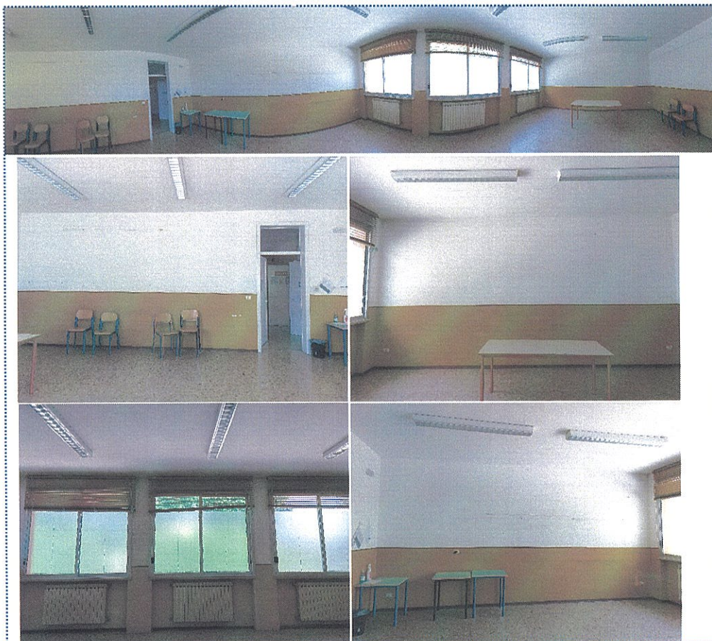
Figura 7-Aula n° 19-Scuola Sec. di Primo Grado-Rivarolo del Re