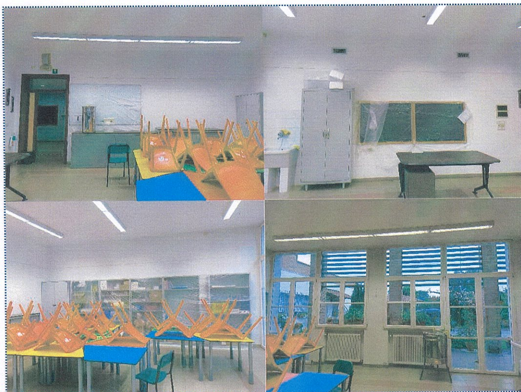
Figura 13 Aula n° 17-Scuola Primaria-Casalmaggiore

-l'aula n° 17 sarà adibita a secondo ambiente di apprendimento per discipline STEAM e Coding, sfruttando le dotazioni già presenti all'interno dell'Istituto e implementando con i nuovi acquisti;