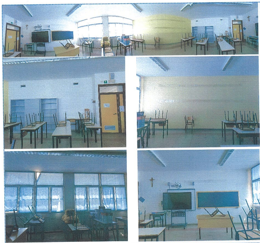
Figura 20 Aula n° 97-Scuola Primaria-Casalmaggiore