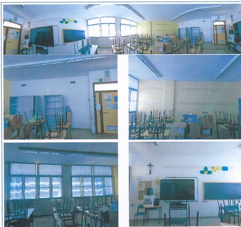
Figura 24 Aula n° 103-Scuola Primaria-Casalmaggiore