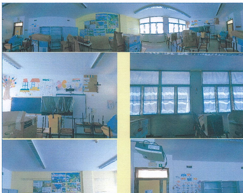
Figura 25 n° 114-Scuola Primaria-Casalmaggiore