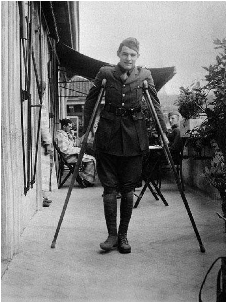
Ernest Hemingway, Milano, 1918.