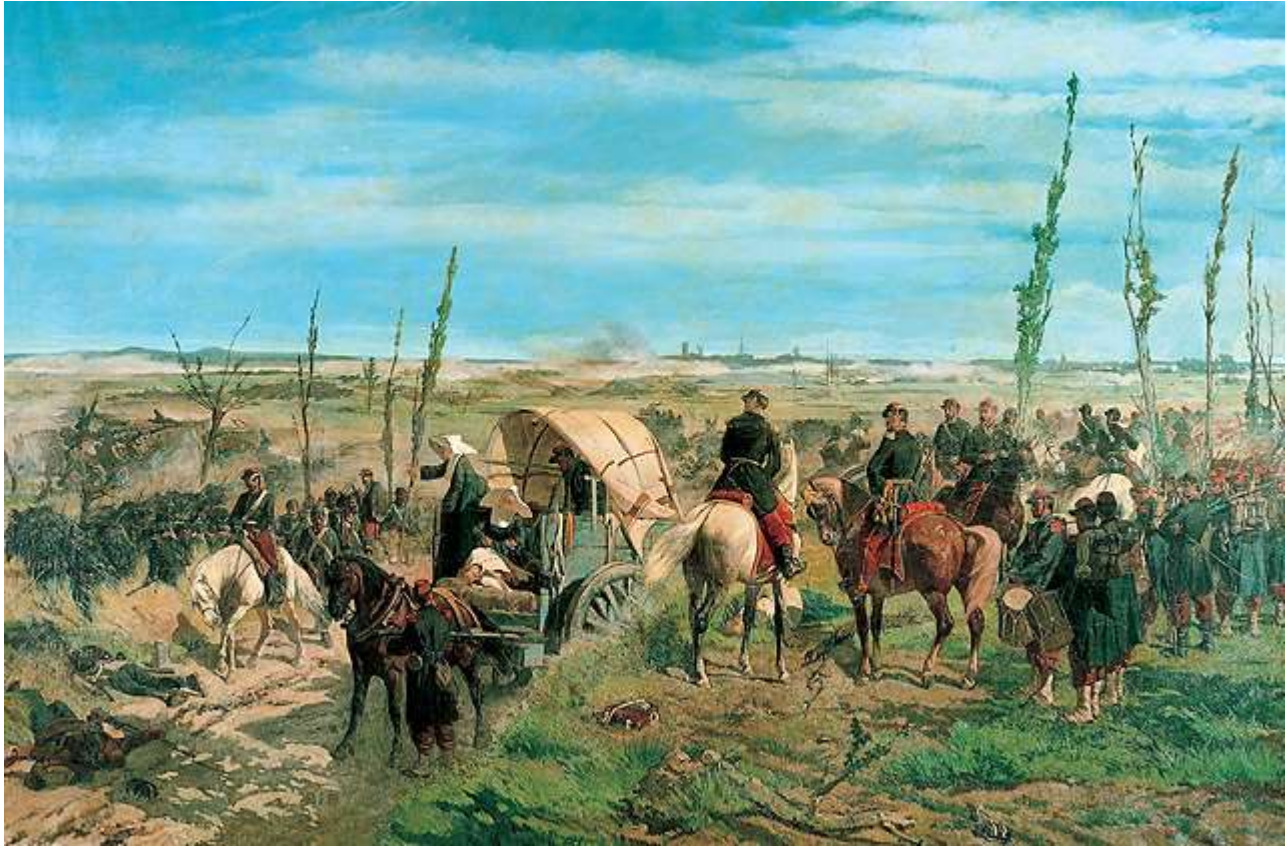
Fonte: Giovanni Fattori, Il campo italiano alla battaglia di Magenta , 1861-1862, Firenze, Galleria d'Arte Moderna di Palazzo Pitti, Firenze