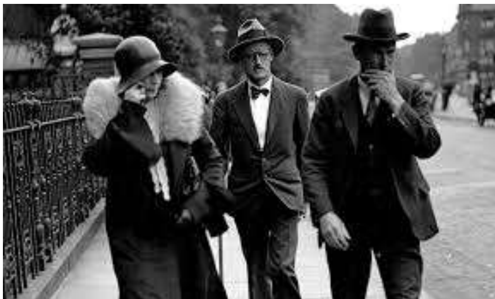
Svevo e Joyce: storia di un'amicizia