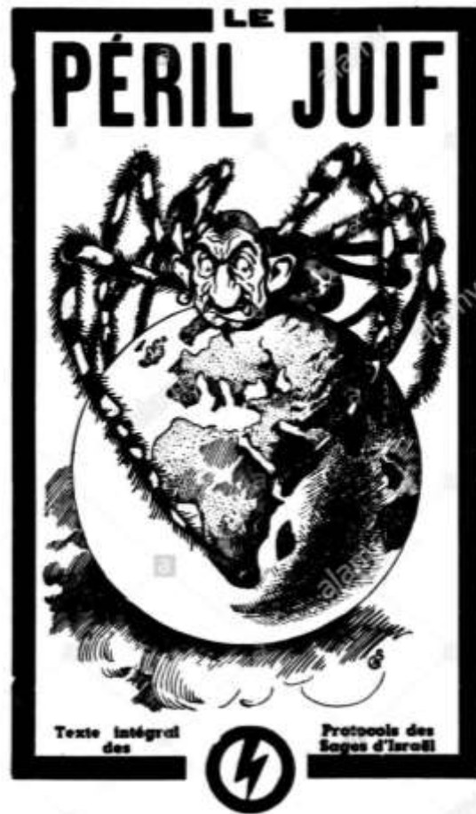
Fonte: copertina di un'edizione francese dei Protocolli dei Savi di Sion (1934)