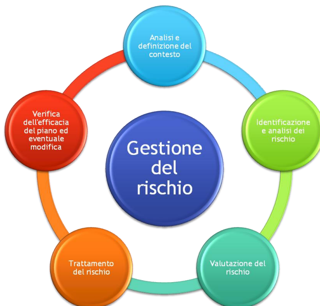
FIGURA 2 - LE FASI DEL PROCESSO DI RISK MANAGEMENT NELLE PREVISIONI DELLA LEGGE 190/2012