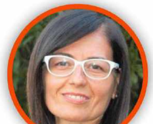
MARIE ANNA FEBBRAIO SECONDARIA DI PRIMO GRADO