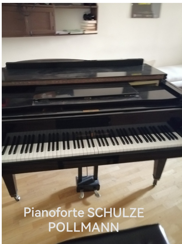
Pianoforte SCHULZE POLLMANN