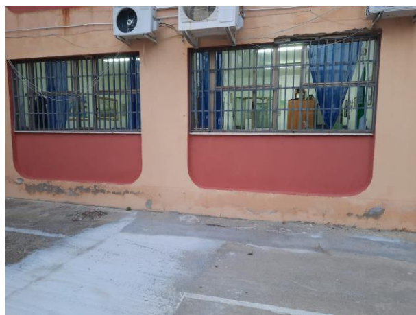
Prospetto Lato sud