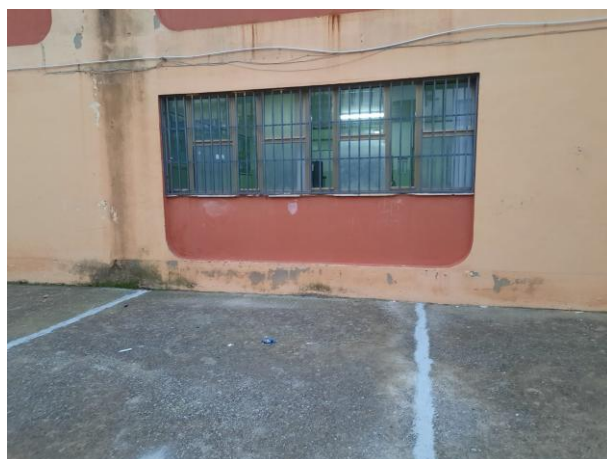
Prospetto Lato est