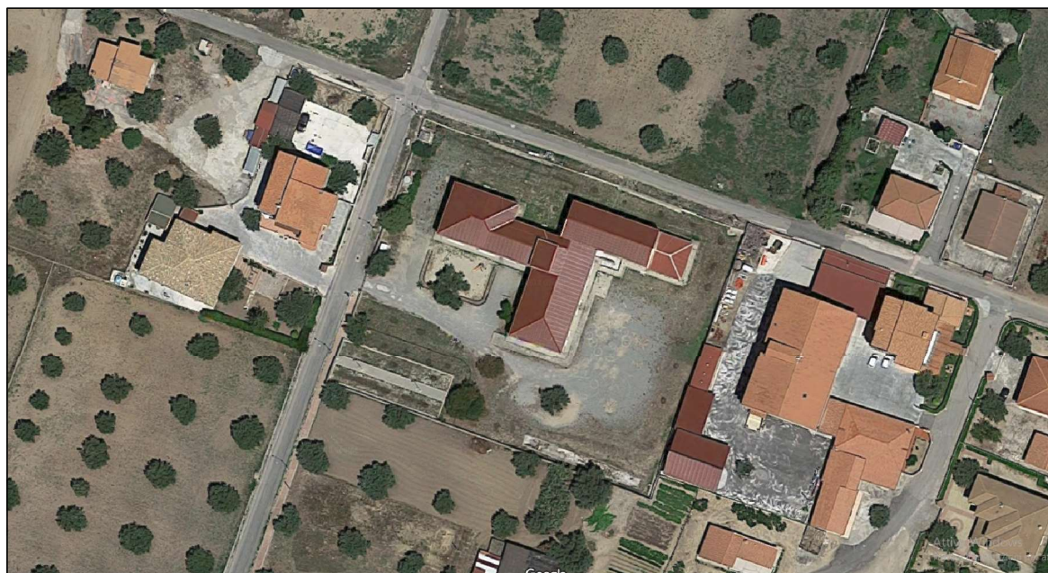
RIFERIMENTO SITOGRAFICO IMMAGINE: https://www.google.it/maps