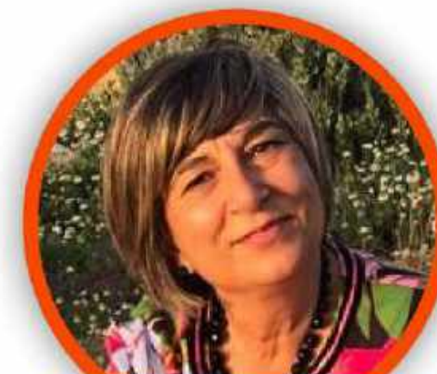
GIOVANNA MARIA BURRELLI SCUOLA PRIMARIA