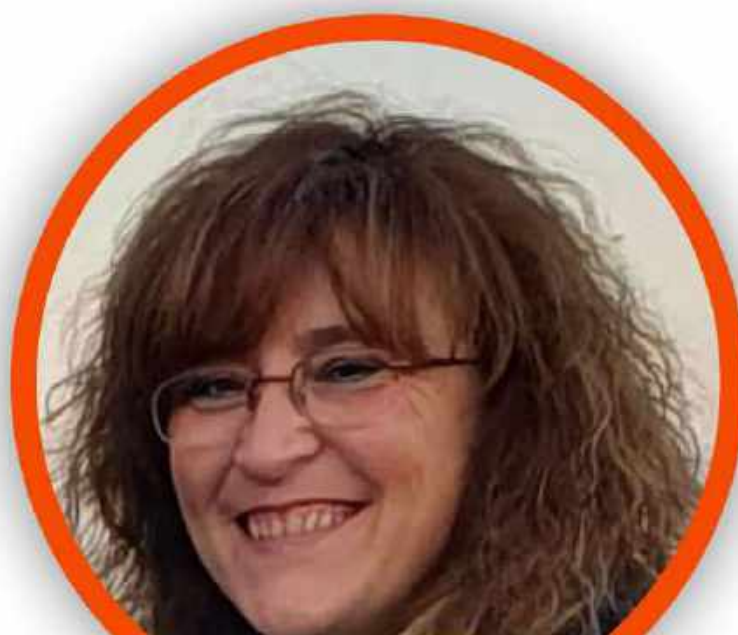
MARIANGELA MAPELLI SCUOLA PRIMARIA