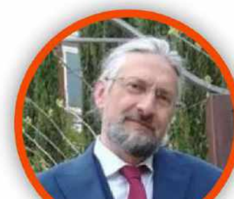
MASSIMO TAVOLA SECONDARIA DI PRIMO GRADO