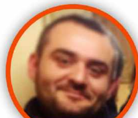
ROBERTO ZOLLO SCUOLA PRIMARIA