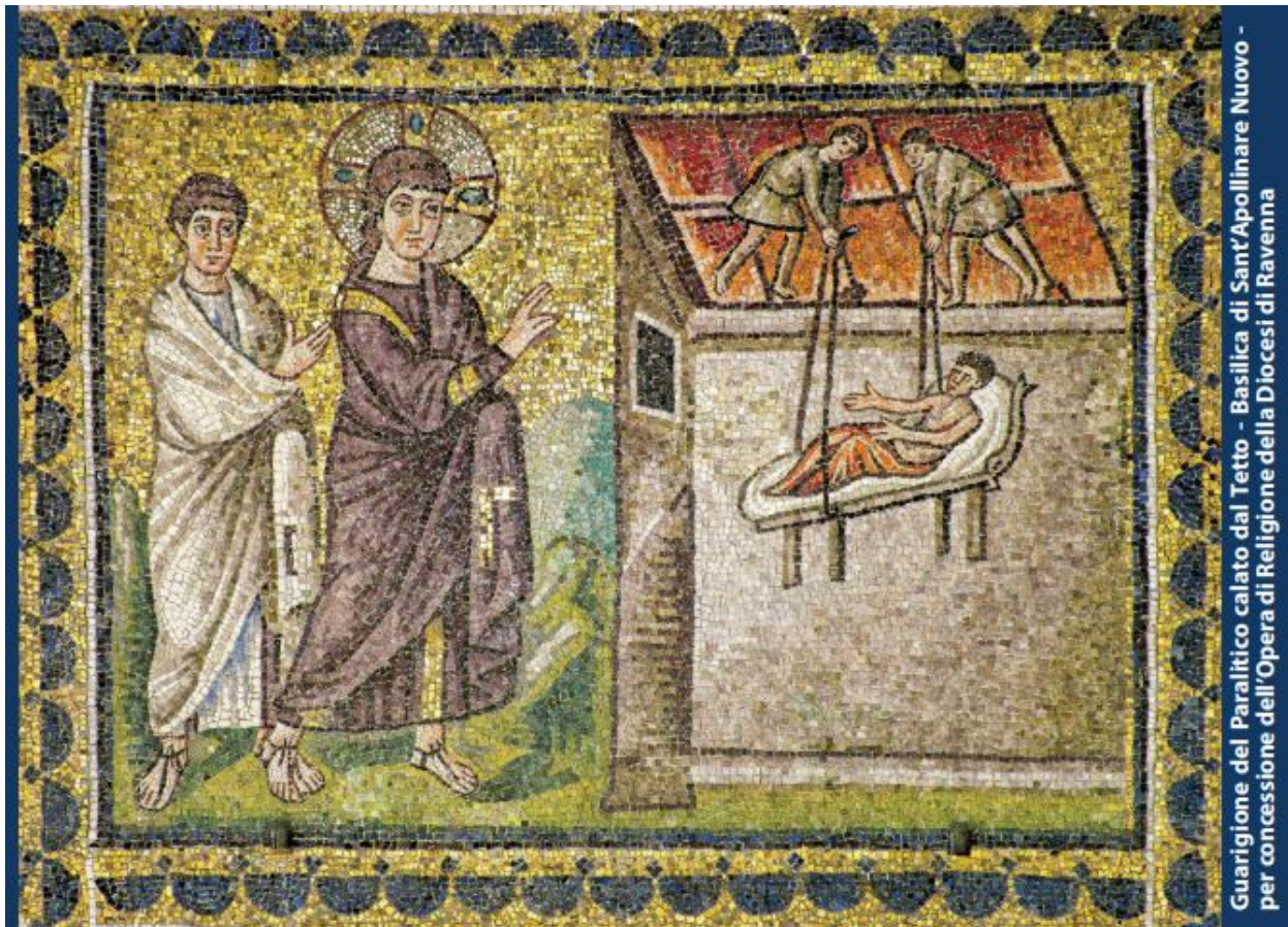
Guarigione del Paralitico calato dal Tetto - Basilica di Sant'Apollinare Nuovo