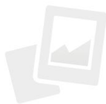
IMMAGINE NON DISPONIBILE