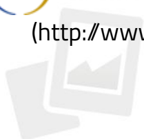
IMMAGINE NON DISPONIBILE