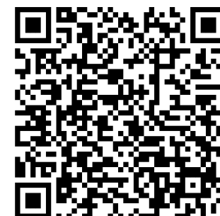
Il memoriale di Yerevan