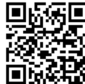
Kit materiale promozione evento

Quando ci sono materiali di approfondimento online il testo è blu e sottolineato: se stai consultando queste istruzioni in formato digitale ti basterà cliccare, altrimenti usa il tuo smartphone inquadrando il QR-code corrispondente.