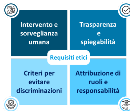
Figura 3 - I requisiti etici per l'utilizzo dell'IA

L'utilizzo sempre più consistente dell'IA nel mondo scuola solleva importanti implicazioni etiche che devono essere affrontate con attenzione per assicurare un impatto positivo e sostenibile, in linea con i principi trainanti le azioni del Ministero. È perciò fondamentale utilizzare tale strumento in modo da assicurare il rispetto di norme e principi etici, così che l'IA possa rappresentare uno strumento affidabile e inclusivo al servizio della comunità scolastica.