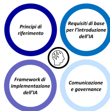
Figura 1 - I pilastri alla base del modello di introduzione dell'IA nelle scuole