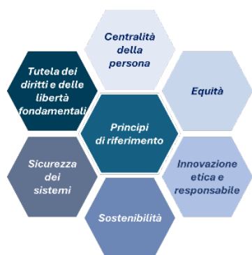
Figura 2 - I principi fondanti della strategia per l'introduzione dell'IA

La strategia per l'introduzione dell'IA è guidata dai seguenti principi di riferimento che costituiscono il fondamento delle politiche e delle azioni intraprese dal Ministero per affrontare con decisione e responsabilità le sfide del futuro, in coerenza con i valori costituzionali, a partire da quelli riconosciuti negli articoli 2 e 3 Cost., delineati ed ulteriormente articolati nelle politiche educative nazionali (art. 9, comma 1 Cost.) ed europee (art. 14 Carta dei diritti fondamentali dell'UE) 3 .