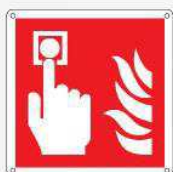
Allarme antincendio F005