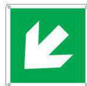
Freccia diagonale a destra/sinistra