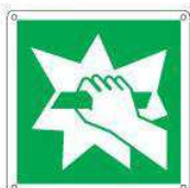
Rompere in caso di emergenza E008