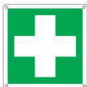
Primo soccorso E003