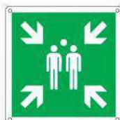
Punto di ritrovo e evacuazione E007