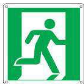
Uscita di emergenza a destra E002