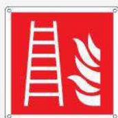
Scala antincendio F003