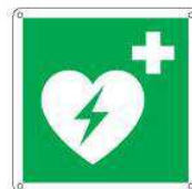
Defibrillatore esterno di emergenza E010