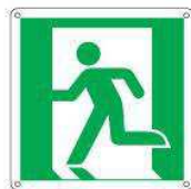
Uscita di emergenza a sinistra E001