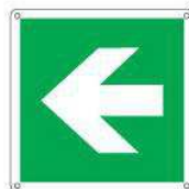
Freccia a destra/sinistra