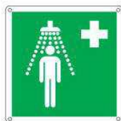
Doccia di emergenza E012