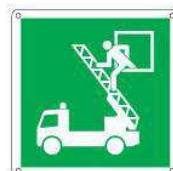
Finestra di recupero e salvataggio E017