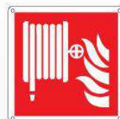
Lancia antincendio - nastro F002