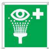
Lavaocchi di emergenza E011