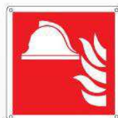
Attrezzature antincendio F004