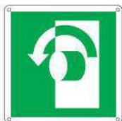
Girare la maniglia in senso antiorario E018