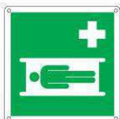
Barella di emergenza E013