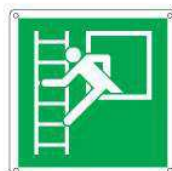
Finestra di emergenza con scala E016