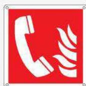
Telefono emergenza antincendio F006