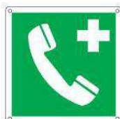
Telefono di emergenza E004