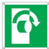
Girare la maniglia in senso orario E019