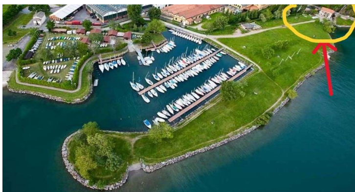
Porto S Cecilia