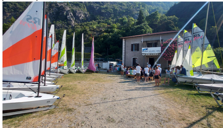
Base Nautica Orza