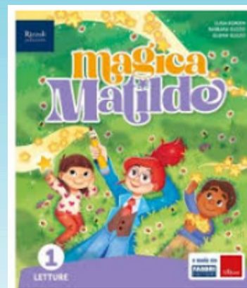
Magica Matilde, Fabbri Editori - Erickson

RINGRAZIANDO PER LA COLLABORAZIONE, LE INSEGNANTI AUGURANO AI BAMBINI E ALLE RISPETTIVE FAMIGLIE, UN BUON INIZIO DI ANNO SCOLASTICO!