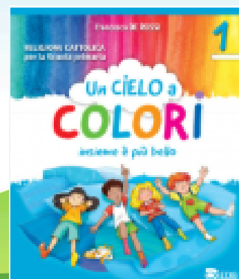
Un cielo a colori, EDB e Giunti