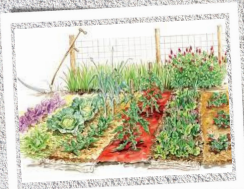
ORTO DIDATTICO - giovedì