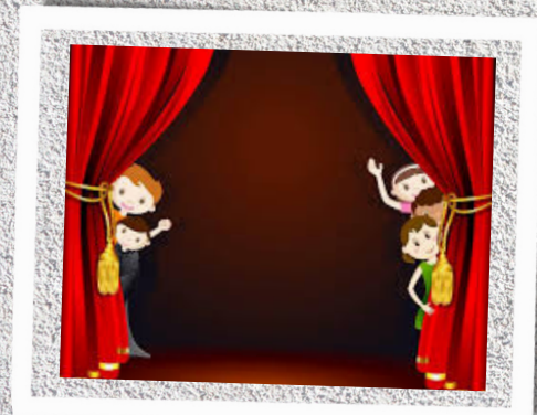
TEATRO - giovedì