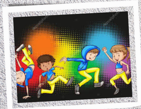
DANZA - venerdì

Il calendario verrà comunicato ai partecipanti.