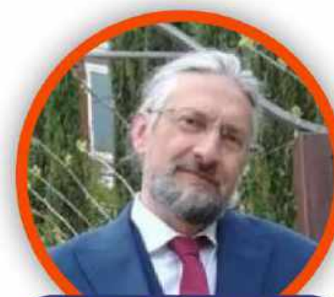
MASSIMO TAVOLA SECONDARIA DI PRIMO GRADO