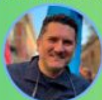
Segretario Generale FEDERAZIONE UIL SCUOLA RUA MODENA