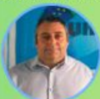
Segreteria Nazionale FEDERAZIONE UIL SCUOLA RUA NAZIONALE