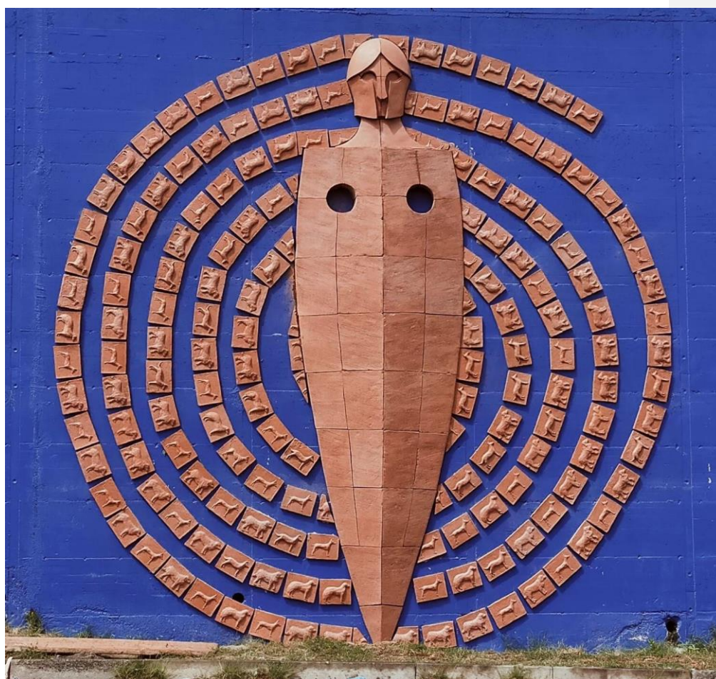
Lancia di Adranos. Porta delle Farfalle Librino (CT)