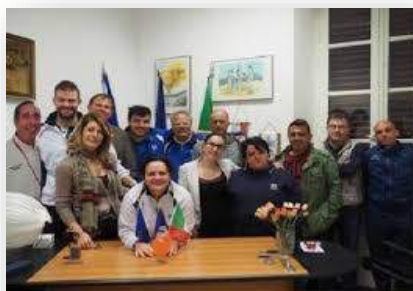
FOLIGNO CSI NEWS 19

Per usufruire degli sconti è necessario esibire la tessera.