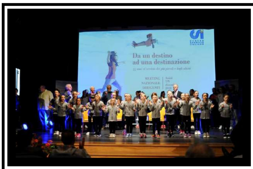
Pag. 2, 3 e 4

«Il Natale è un incontro, non solo una ricorrenza temporale, il ricordo di qualcosa di bello. Il Natale è di più. Noi andiamo lungo questa strada per incontrare il Signore con il cuore e la vita».