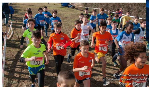
10° Criterium Giovanile di Cross Campionati Regionali Individuali di Cross Foligno 21-01-2018