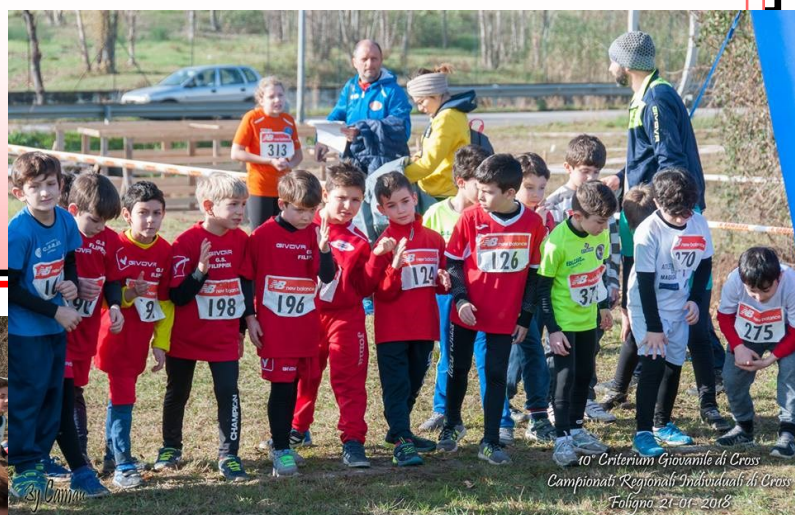
10° Criterium Giovanile di Cross Campionati Regionali Individuali di Cross Foligno 21-01-2018