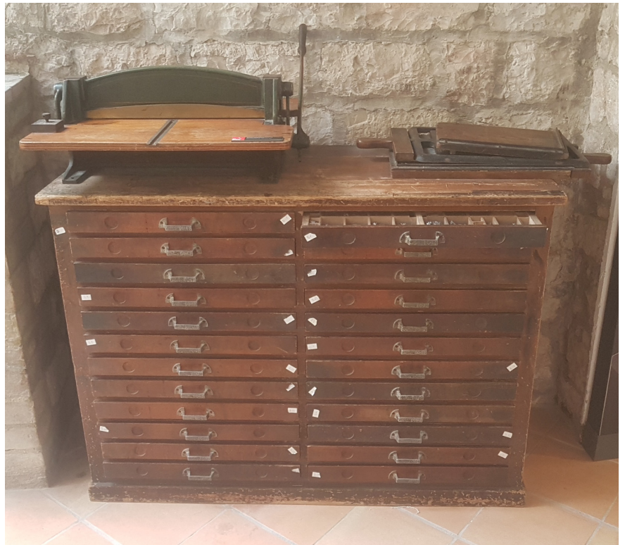
La macchina tipografica che ha stampato i documenti falsi

SI FA PRESENTE CHE SI POSSONO SCEGLIERE PIÙ ATTIVITÀ DA FARE IN UN'UNICA SOLUZIONE O PIÙ SOLUZIONI E CHE LE ATTIVITÀ LABORATORIALI SONO FACOLTATIVE E PROPEDEUTICHE A UNA PRODUZIONE FINALE.