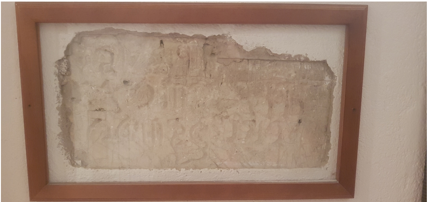
(Scritta in ebraico incisa dagli ebrei nei muro del sotterraneo dell'episcopio in cui erano nascosti)

info@assisimuseodellamemoria.it / assisimuseodellamemoria@gmail.com