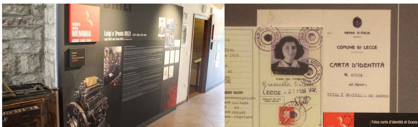
A sinistra: i tipografi Brizi stamparono le carte d'identità false per salvare gli Ebrei. A destra: una delle carte d'identità.