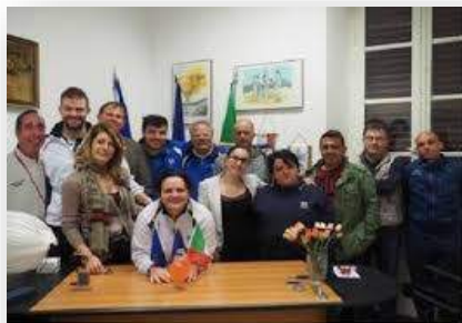
FOLIGNO CSI NEWS 14