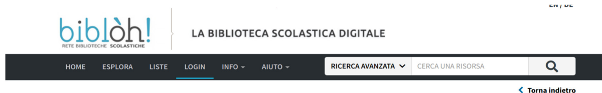
FIG.3: SI RICEVERÀ VIA EMAIL IL CODICE UTENTE E IL LINK PER SCEGLIERE LA PASSWORD.

Nb vanno idoneamente conservate. La scuola non potrà intervenire in relazione alla perdita delle credenziali e ciascun singolo utente dovrà sempre rapportarsi con la piattaforma mloL.