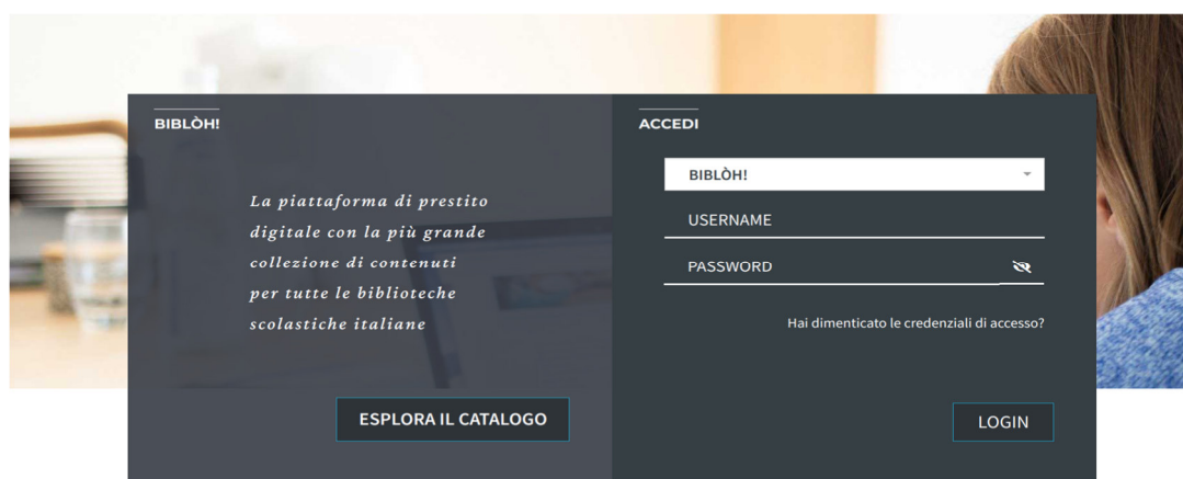
FIG. 1: HOME PAGE https://bibloh.medialibrary.it/home/cover.aspx

Si evidenzia che le credenziali di accesso dovranno essere idoneamente conservate a cura di ciascun utente.