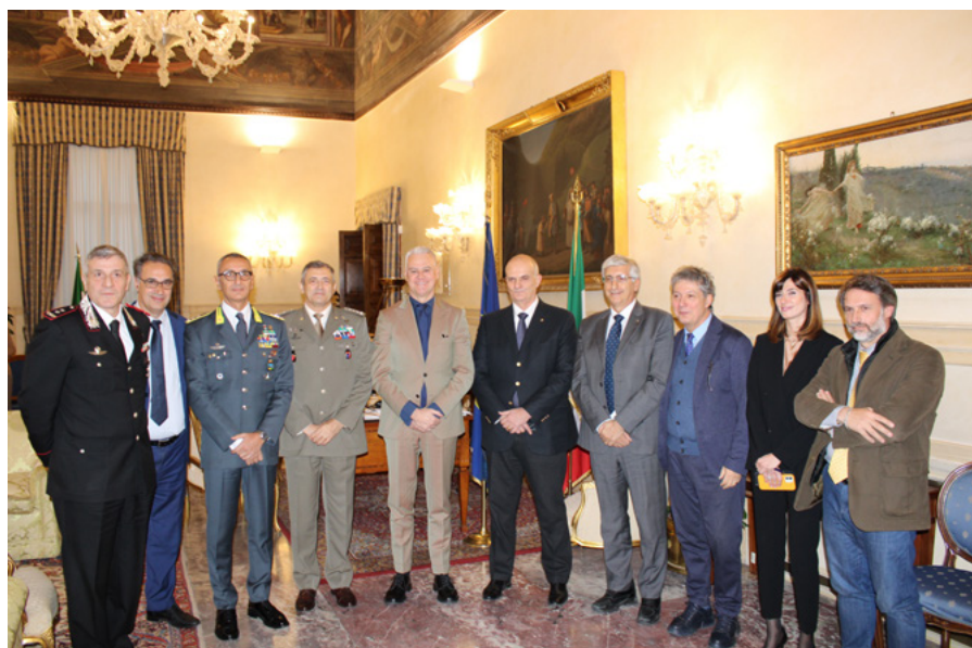
Il ministro Paolo Zangrillo incontra Forze armate, Forze di polizia e Corpo nazionale dei Vigili del fuoco.

In un'ottica di semplificazione delle procedure selettive, e con l'obiettivo di rendere inPA sempre più il punto unico di accesso a tutte le offerte di lavoro nel settore pubblico, il Dipartimento della funzione pubblica e le Forze armate, le Forze di polizia e il Corpo nazionale dei Vigili del fuoco hanno sottoscritto un protocollo d'intesa .