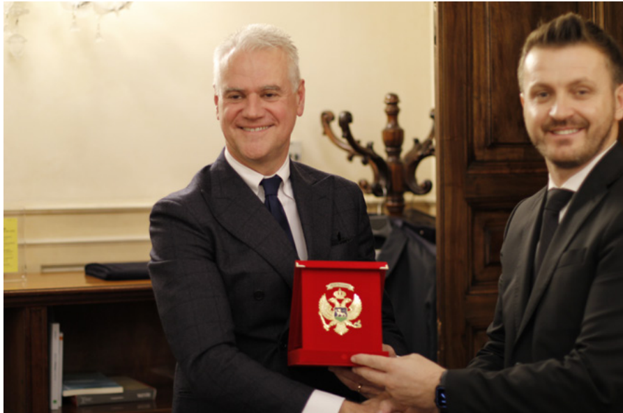
Il ministro Zangrillo e il suo omologo montenegrino Dukaj

Il Ministro per la pubblica amministrazione Paolo Zangrillo ha ricevuto il 14 dicembre a Palazzo Vidoni Marash Dukaj, Ministro per la pubblica amministrazione del Montenegro, nel contesto della sua visita in Italia. Al centro dei colloqui, vi è stata la collaborazione bilaterale in materia di modernizzazione della Pubblica Amministrazione , anche alla luce della strategia di riforma che il Governo montenegrino ha avviato con orizzonte 2022-2028. Sono state discusse le opportunità di cooperazione tecnica in tale contesto, considerando la prospettiva di un progressivo avvicinamento del Montenegro alle istituzioni europee.