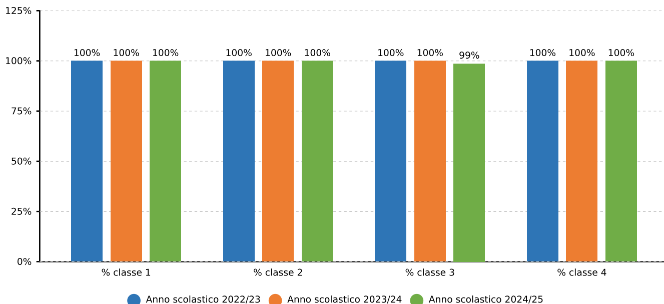
2.1.a.1 Studenti ammessi alla classe successiva - PRIMARIA