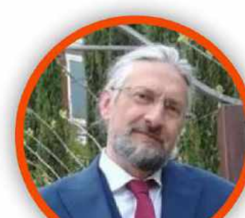
MASSIMO TAVOLA SECONDARIA DI PRIMO GRADO