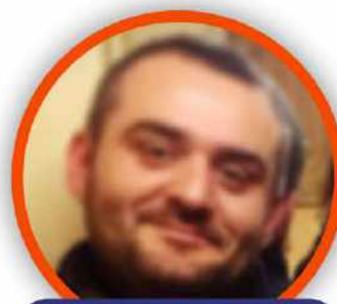
ROBERTO ZOLLO SCUOLA PRIMARIA