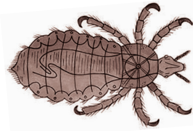
Pidocchio dei capelli Head lice Saçlardaki bitler