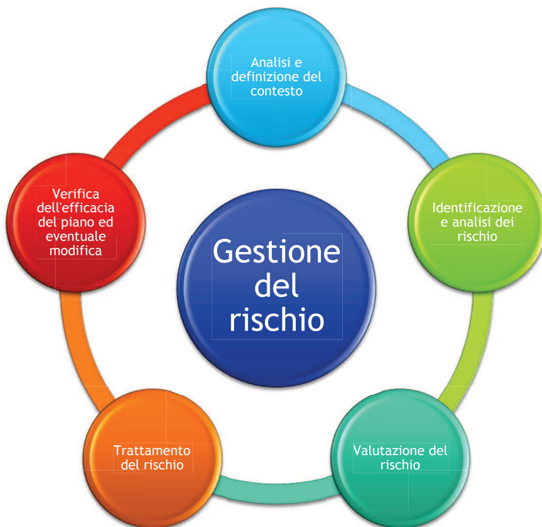
FIGURA 2 - LE FASI DEL PROCESSO DI RISK MANAGEMENT NELLE PREVISIONI DELLA LEGGE 190/2012

Il PNA, d'altro canto, come sottolineato dal relativo aggiornamento, non impone uno specifico metodo di gestione del rischio lasciando le amministrazioni libere di individuare metodologie atte a garantire lo sviluppo progressivo dell'intero complesso sistema di prevenzione; questa flessibilità, come vedremo, è particolarmente opportuna nell'ambito scolastico, che per natura e logistica si differenzia notevolmente dalla realtà ministeriale su cui è stata costruita la versione base del modello di gestione del rischio.