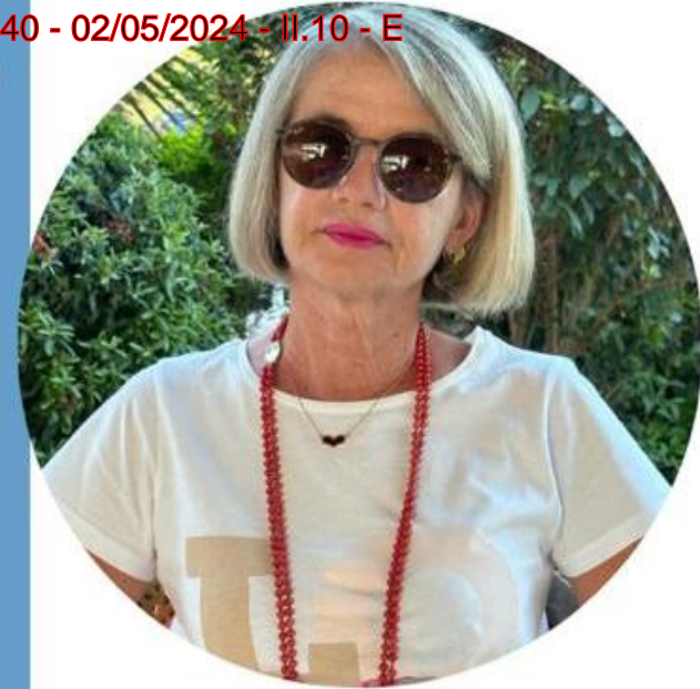
Michela Acconci Scuola Primaria

Ecco il perché della mia candidatura e la scelta di questo Sindacato che ha fatto proprie le lotte per una SCUOLA DEMOCRATICA, LIBERA che sappia dare dignità' alla professione degli insegnanti e che passi anche da una " giusta" riqualificazione economica.