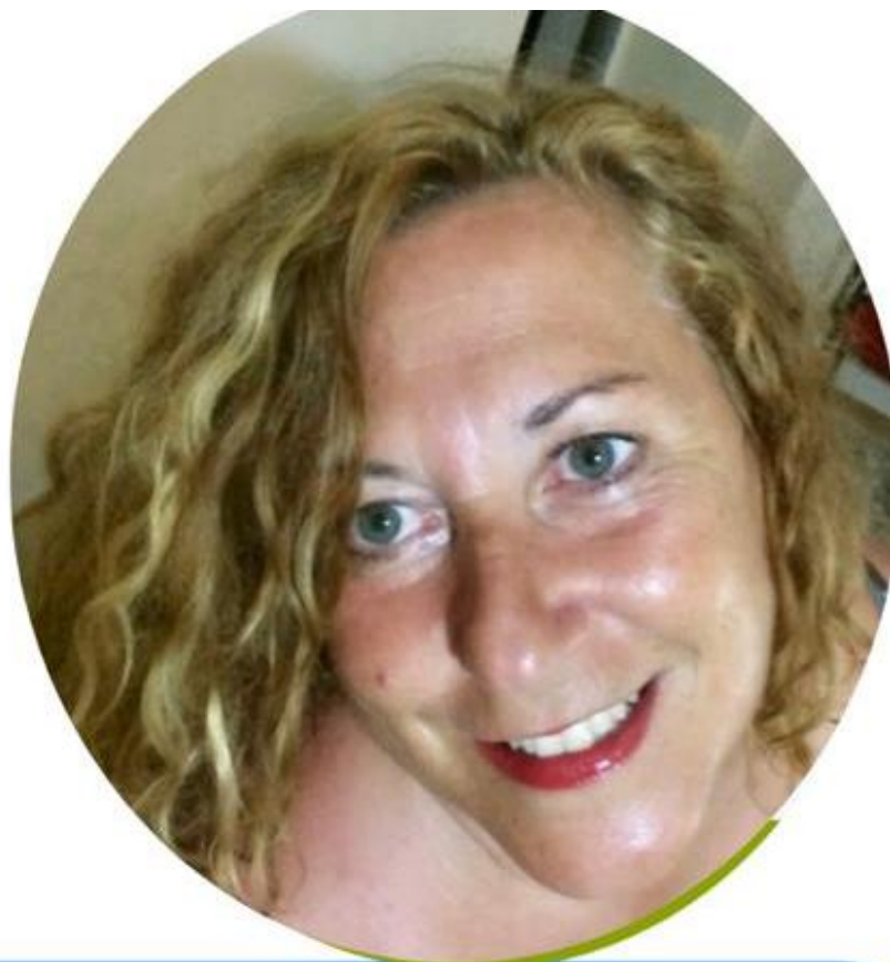
EMILIA MEZZATESTA SCUOLA PRIMARIA

Ho accettato di candidarmi in questa lista perché credo nelle cose umili, ho sempre lottato per il riscatto sociale e la dignità della persona, promuovendone la crescita personale e sociale. Conosco il mondo della scuola paritaria, della scuola pubblica e della cooperazione sociale. Ogni giorno della mia vita dal 1990 l'ho vissuto educando, empatizzando con alunni, colleghi, famiglie, associazioni. Ritengo che la nostra presenza nel mondo del sindacato dei "Grandi" possa fare la differenza. Se sei sfiduciato/a e non ti senti ascoltato/a sappi che tanti docenti sono nella tua stessa condizione. Fai un passo di fiducia, aiutaci a riappropriarci della dignità del ruolo, ormai perso nel tempo.