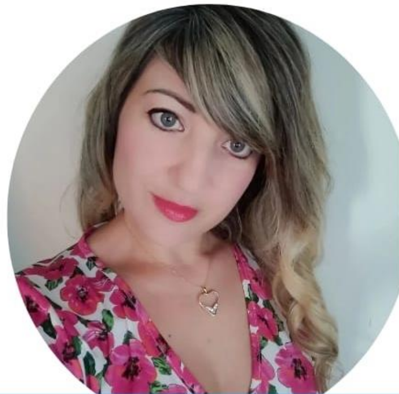
Vanessa Acri Scuola Primaria

Voglio una scuola ove integrazione e inclusione non siano solo belle parole sulla carta ma qualcosa di reale e concreto. Voglio che i docenti si sentano motivati nel loro lavoro perché adeguatamente riconosciuto nella sua dignità e adeguatamente remunerato. Voglio docenti con la voglia di portare i bambini in gita perché lo Stato gli riconosce la trasferta e li tutela giuridicamente. Voglio una scuola che abbia ambienti idonei all'apprendimento e con i giusti strumenti e non tanti fondi investiti male a causa dei troppi vincoli imposti. Insieme possiamo! Scegli NoiScuola Bene Comune.