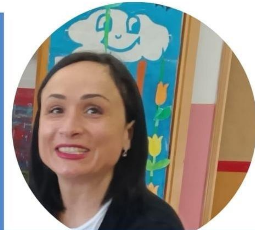
CAROLINA PARISI SCUOLA DELL' INFANZIA

Per me insegnare non è solo un lavoro, ma una vera e propria passione. Ho scelto questa professione con consapevolezza, lasciando alle spalle un posto fisso in un'altra pubblica amministrazione. Il desiderio di trasmettere conoscenze e di fare la differenza nella vita dei ragazzi ha prevalso sulla stabilità economica. Conosco bene le sfide e le difficoltà che ogni giorno affrontiamo nelle scuole. Per questo motivo, ho deciso di candidarmi al CSPI: voglio essere la vostra voce nelle istituzioni e portare avanti le vostre esigenze e preoccupazioni. Voglio rappresentare al meglio la nostra categoria e contribuire a costruire un futuro migliore per la scuola italiana.