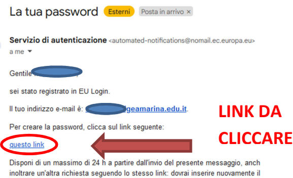
Fig. 3 Mail che conferma l'iscrizione con cui creare la PASSWORD

Una volta completato il Login si deve ricliccare il LINK presente nella circolare e completare i campi che vengono richiesti per concludere l'iscrizione a SELFIEforTEACHERS quindi salvare dopo aver spuntato "Accept the privacy policy" . (Fig. 4)